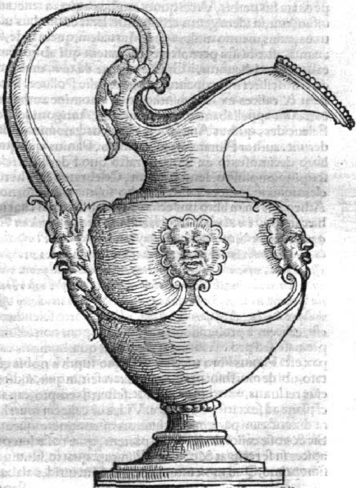
L 3 Vrcei

Vrcei figura, quo aqua in aneum infundebatur.