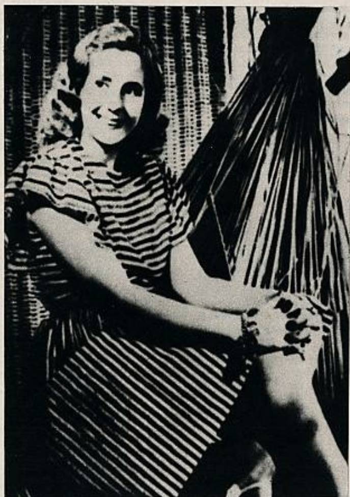
Evita, cuando "recién" se lanza a la conquista de Buenos Aires.

L A figura de Evita resulta inexplicable, separada de su época y las condiciones objetivas de su país. Argentina, en el primer cuarto de este siglo, pasa por la misma pugna de los países europeos en lo que concierne a política so-