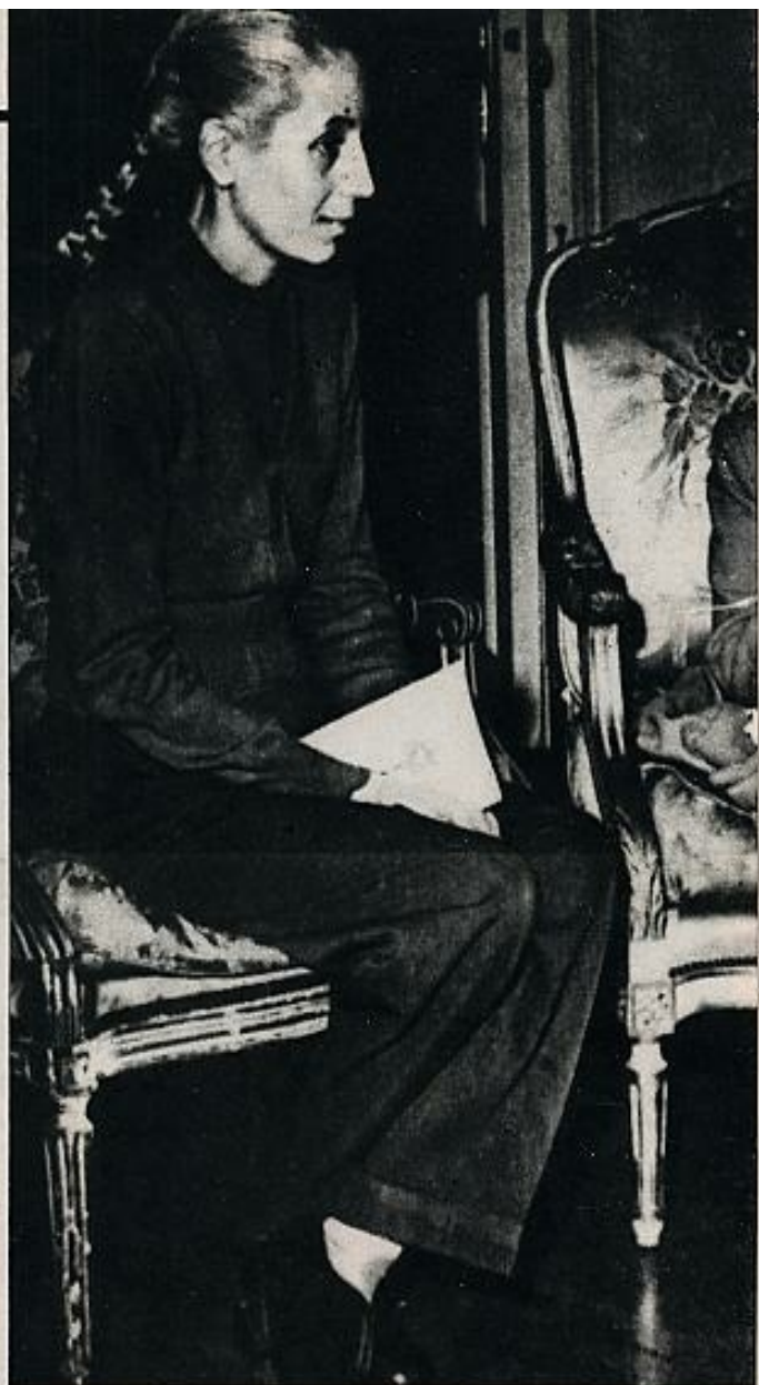
Las huellas de la leucemia se acusan ya en este rostro melancólico.

Del mismo modo hay en "Evita" todo un muestrario del paternalismo político y la interpretación más