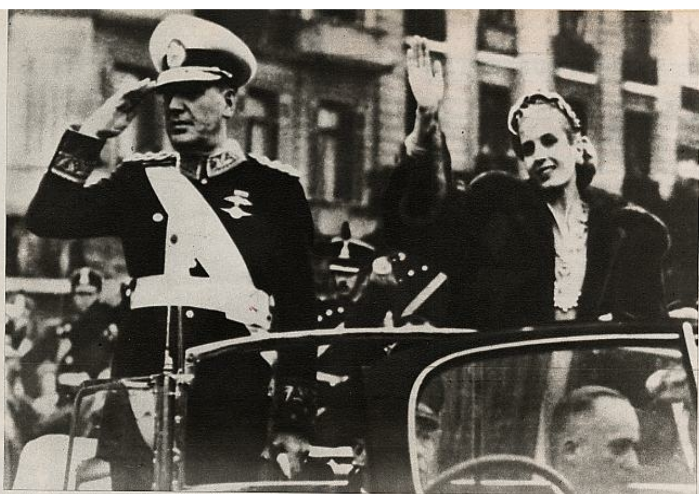
Juan Domingo y Eva llegan al poder, y ella le ayudará en la captación de trabajadores, mujeres..., así como en ofrecerle una imagen excepcional ante el mundo.