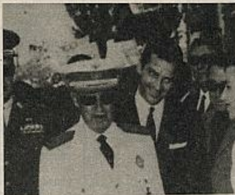
Suárez con Franco.

Si Unión de Centro Democrático tenía la ilusión