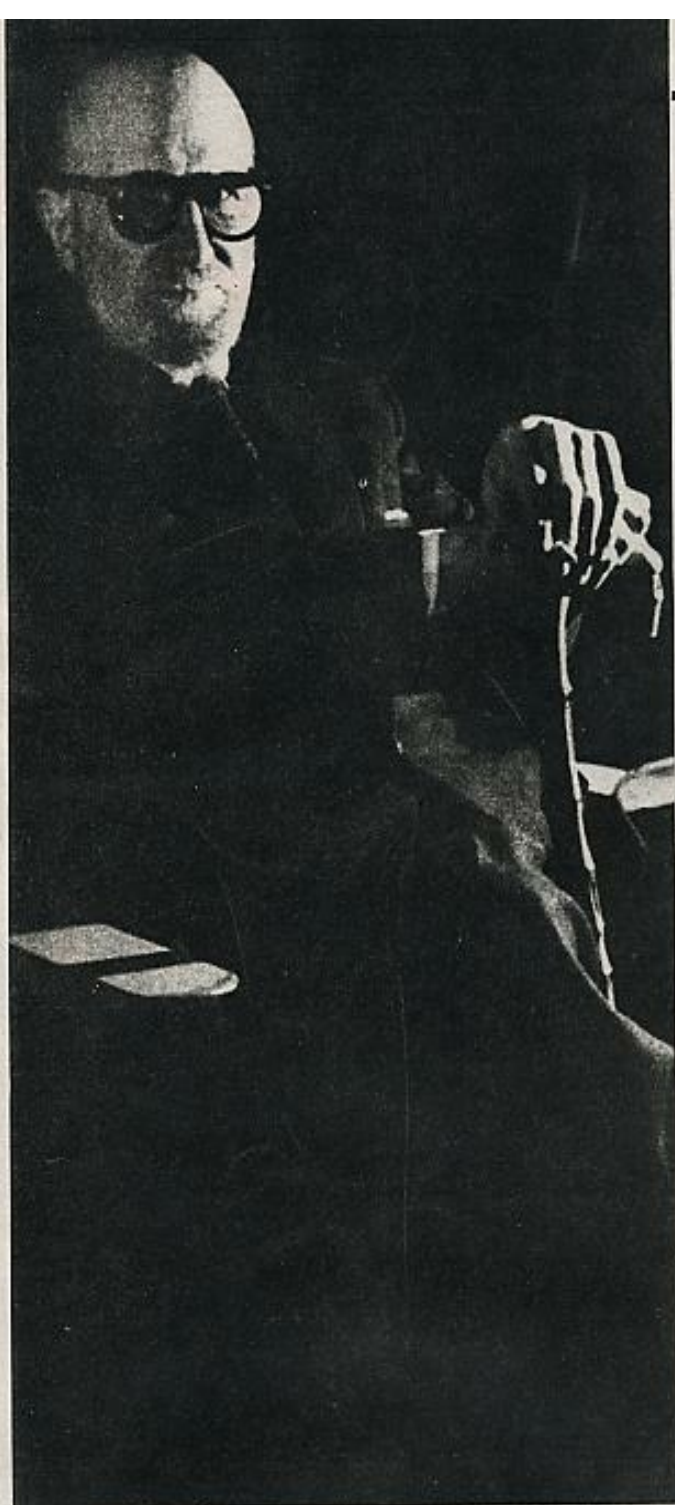
El autor de Versos y oraciones del caminante , en machadiana pose.

ahora pensamos en él, sabe que todo cuanto he dicho de los poetas muertos y de la Poesía asesinada, lo he dicho por él y para él.