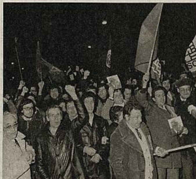
Los militantes socialistas y comunistas se lanzaron jubilosos a las calles que ya creían suyas por victoria unitaria.

La radio, tras comunicar los titulares de los periódicos madrileños, informó de los incidentes que se habían producido en la plaza Mayor y en la plaza de la Villa. La madrugada avanzaba, pero no esclarecía. Llovió intensamente durante horas y el sol no consiguió aparecer hasta bien entrada la mañana. Líneas de sombra surgían tras la victoria. Los apretados datos de la radio se hacían radios, errantes. "Jota nueve, recibido mensaje. Hache veinte. Corto". ■