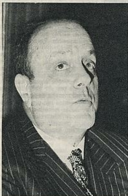
Fraga Iribarne: "Poner a raya a los piquetes y pandillas de cualquier motivación".

E S necesario que vuelva la serenidad. A la izquierda y a la derecha, a todos los sectores del país. No hay que escudarse en hechos de que en otros países ocurre lo mismo y aún peor —sin dejar de tener en cuenta que es así, y que hay causas profundas para ello—, ni que en cualquier tiempo pasado fue peor. Nuestra tarea, la de todos, es la de mantener la serenidad y olvidar todas nuestras posibilidades de amenaza y probablemente ese es el consenso que es posible, y no otros. El Gobierno tiene mucho que hacer, mucho que decir en este camino, que le interesa en primerísima medida. ■