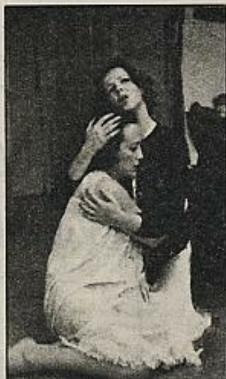
"Al servicio de la mujer española", de Jaime de Armiñán.

"Al servicio de la mujer española" es de nuevo ese juego. Nada más cotidiano en nuestro país que los consultorios radiofónicos donde se van lavando los cerebros de los radioyentes para introducirles, sistemáticamente, la necesidad del conservadurismo y la represión. Tan cotidianos y tan inevitables que pocos intelectuales les han prestado atención. Son como un mal consagrado que sólo produce la risa o el desprecio. Armiñán, en cambio, confecciona alrededor de uno de ellos la historia de una toma de conciencia, de una venganza, de una crisis: uno de los oyentes de ese programa decide vengarse de la responsable del