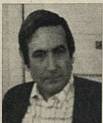
Antonio Bonet Correa.

Se trata de una colección de artículos del profesor Bonet Correa. Todos están conectados por una idea común. La España que precedió a la revolución industrial es en cierta manera la inspiradora de la España de