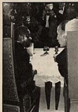
Bokassa y Giscard D'Estaing.

A Rojas Marcos no le han regalado ninguno. Y tendrá una cena de navidad llena también de discusiones, dispuesto como está a expulsar de su partido a los siete disidentes.