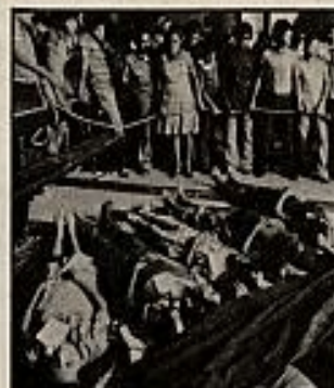
Víctimas de la guerra civil de El Salvador.

Claro que, a pesar de eso, o precisamente por ello, las cosas continúan igual. Con el incremento de la ayuda militar al gobierno de El Salvador, dicen que se ha aniquilado la guerrilla. Y en España, con los fríos que no acaban de irse digan lo que digan los meteorólogos, los ultraderechistas vallisoletanos que venían aterrando a la ciudad durante los últimos