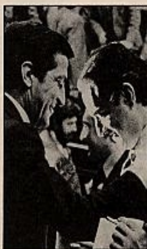
Adolfo Suárez y Landelino Lavilla.

Solo va a quedarse Suárez a juzgar por la crisis que ya se anuncia en su UCD.