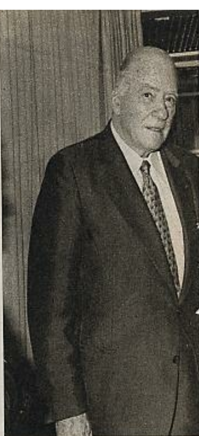
Tarradellas y lo que él debe de entender

Los argumentos de Tarradellas se centraron en que "no conviene precipitarse, ante la disolución de las Cortes, con un proyecto que es partidista y que parte del pueblo catalán no quiere". En vano replicaron los parlamentarios que "el proyecto de Estatuto es de todos" y que si no entra ese proyecto en las Cortes de forma inmediata sufrirá meses de retraso al disolverse las Cortes, constituirse otras y establecer un calendario en el que ese Estatuto tenga cabida para su discusión. Pero todavía el proceso puede alargarse más y más si Tarradellas decide finalmente no convocar la Asamblea de Parlamentarios que debe tramitar el proyecto de Estatuto hacia Madrid o hacerlo con un retraso irrecuperable: sobre la base de cualquier ligera modificación de la correlación de fuerzas en los próximos comicios se exigirá una revisión y quién sabe si una nueva redacción del proyecto de Estatuto. Si Tarradellas persiste, pues, en actuar en estos días decisivos como un auténtico cortocircuito entre el trabajo de los parlamentarios catalanes que han cumplido el mandato popular de elaborar el Estatuto y el Madrid al que disgusta ese trabajo, habría que preguntar