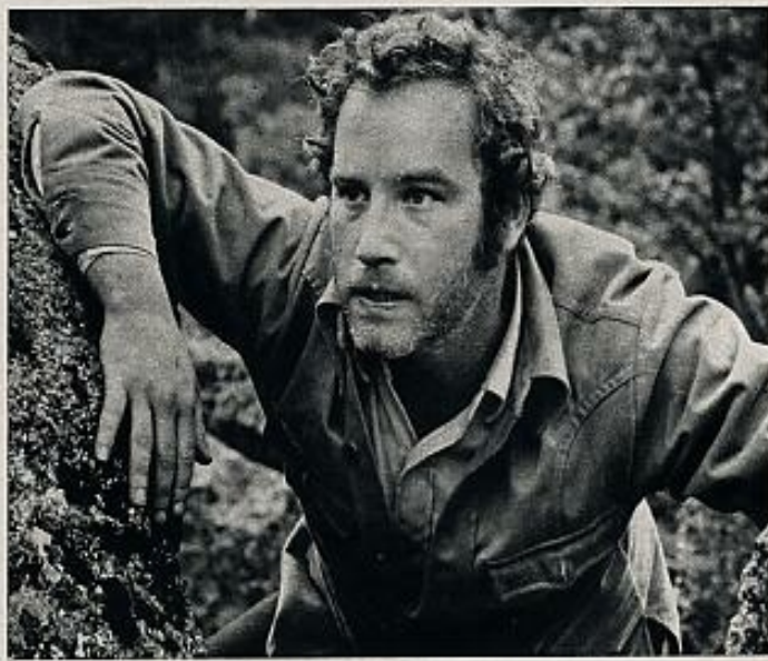
"Encuentros cercanos en la tercera fase" —película a la que pertenecen estos cuatro fotogramas— trata sobre la curiosa manera en que son manipuladas y ocultadas las visiones de ovnis declaradas por unos quince millones de americanos, entre los que se cuenta su actual Presidente, Jimmy Carter.

Spielberg realizó múltiples entrevistas, pero se encontró con una barrera insalvable: la falta de un estudio oficial sobre el tema. En efecto, existe un famoso libro (el "Blue Book"), donde se recogen las observaciones de ovnis que han tenido lugar en Estados Unidos. El susodicho libro, sin embargo, presenta los datos por orden exclusivamente cronológico y los encargados de su confección no parecieron tener el menor interés en codificar dichos datos a fin de que con medios cibernéticos pudieran deducirse una serie de constantes tanto en el carácter de las observaciones como en sus sujetos (los ovnis) o el de las relaciones espacio temporales entre las mismas. El "Blue Book" se ha convertido así en una montaña de datos lacónicos imposibles de descifrar. Este obstáculo (que, sin duda, responde a recomendaciones del famoso panel) ha impedido a Spielberg la reconstrucción científica de dichas posibles constantes, por lo cual ha tenido que lanzarse en los brazos de la denuncia, ese derecho al pataleo que tal vez sea el más respetado y fomentado de todos los humanos.