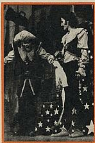
"El dragón", de Schwartz, en la versión del grupo Cizalla.

Ciertamente, los medios técnicos del teatro independiente son escasos, reducido el número de actores de cada grupo, y cortísimas las posibilidades de un escenario como el de la Cadarso —y el de la mayor parte de los lugares donde tales grupos trabajan—; lo cual no hace sino frenar los evidentes buenos deseos de Cizalla y reducir más y más la magia irónica del relato a la farsa, con sus claves políticas precisas. El grupo se