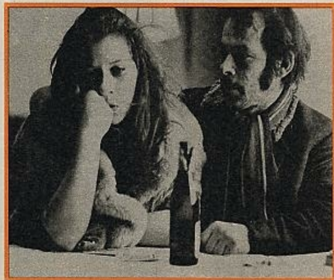
"Stroszek", de Werner Herzog.

Una espléndida historia de amor. Pero por esto ya no puede entenderse el romanticismo hueco, las miradas tiernas, el final feliz y alegre de los amantes. Cualquier historia de amor, como cualquier historia simple-