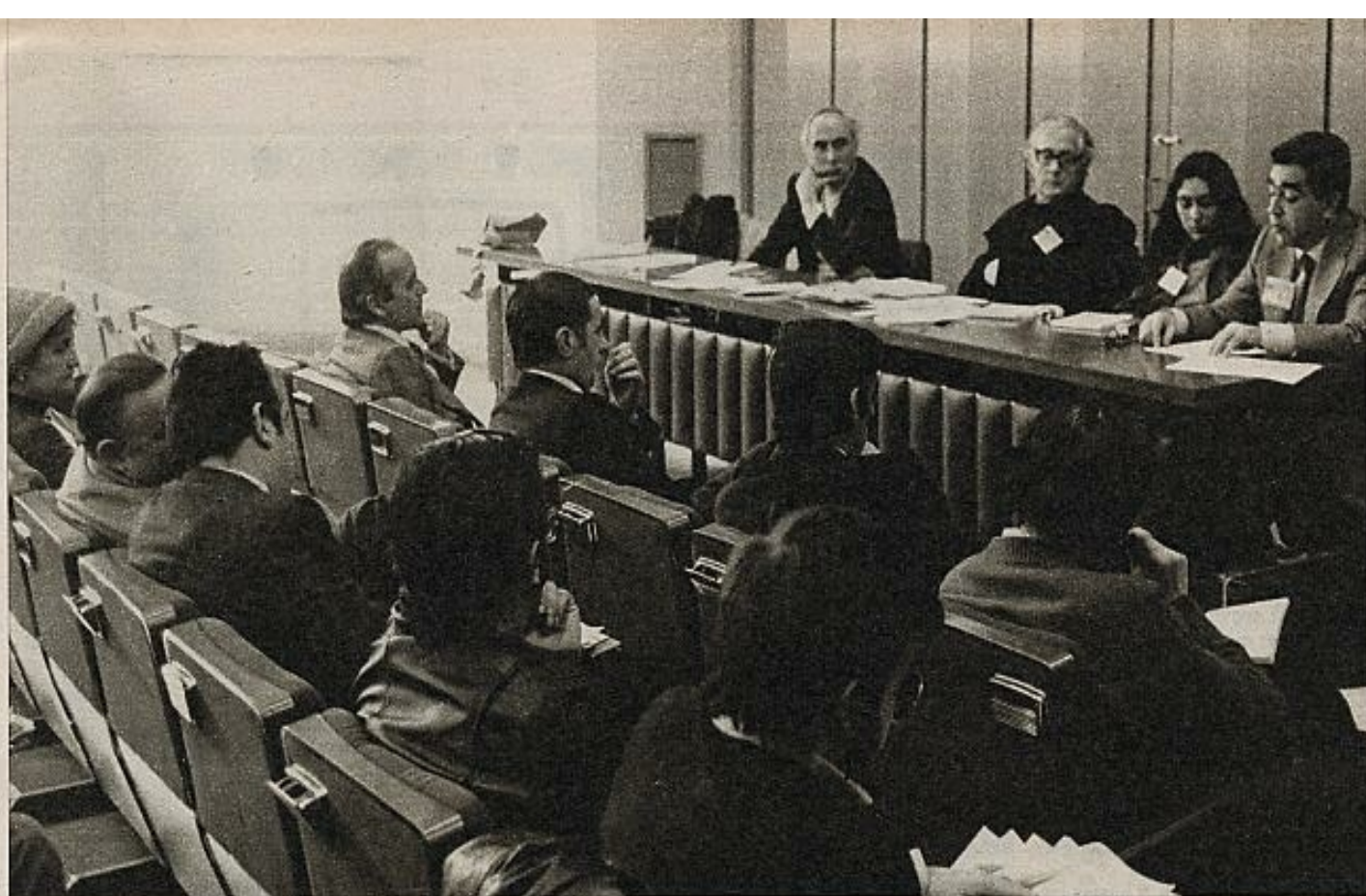
Los principios que han animado este primer Congreso serán traducidos en el Parlamento en una ley tajante y operativa.