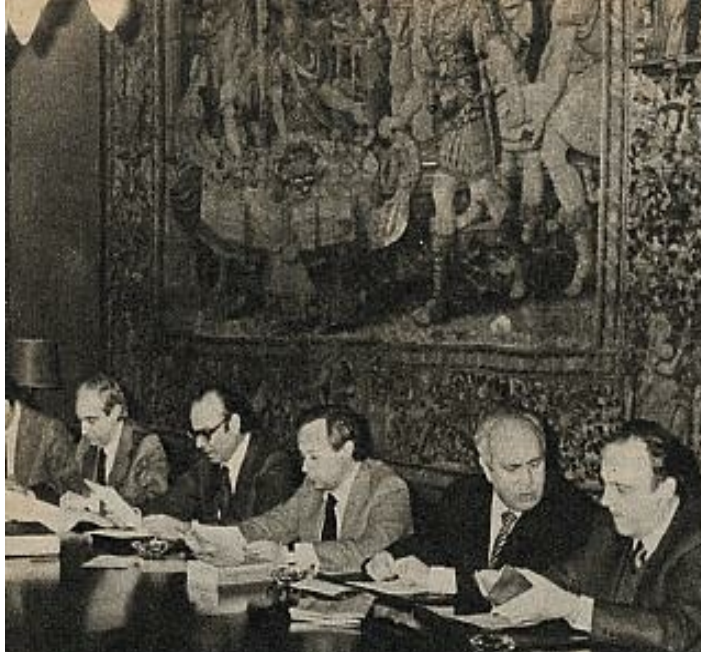
ad de dictaminar acerca de la extraordinaria y urgente necesidad del Decreto-seguridad ciudadana".