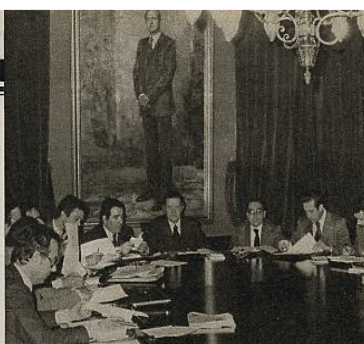
La Diputación permanente del Congreso, sobre la que recayó la responsabilidad Ley "sobre protección de la