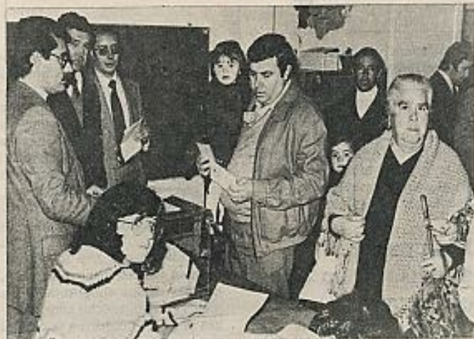
El referéndum ha sido una batalla ganada exclusivamente por el pueblo andaluz. En la foto: cordobeses votando.

Granada ha respondido a la pregunta de Jiménez Blanco: "Papá, ¿Andalucía es Sevilla?". "Me satisface especialmente —dijo Clavero el día 29-F, refiriéndose a Granada— destacar cómo el andalucismo no es un monopolio de Sevilla, sino de todas las provincias y de todos los andaluces".