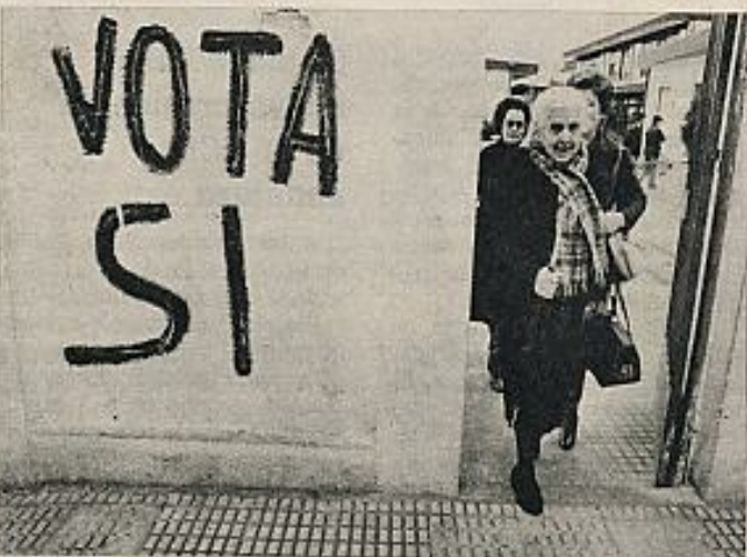
La ley, discriminatoria con Andalucía, le impide ahora continuar el proceso autonómico por la vía que han elegido más del cincuenta y cinco por ciento de los andaluces.

El pasado sábado llegó a Almería Alejandro Rojas Marcos con un equipo de técnicos. Según los andalucistas, hay 15.000 fallecidos en las listas del censo, además de los emigrantes y los menores de dieciocho años. El lunes llegaron también a la capital almeriense dirigentes y técnicos del PSOE. El trabajo, ahora, con-