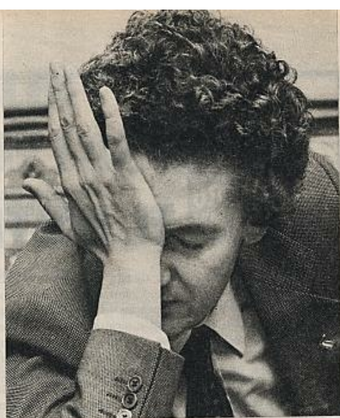
El presidente de la Junta andaluza, Rafael Escuredo, ha estado solo durante la campaña.

A NDALUCIA podría ser el Waterloo de UCD. El resultado del referéndum es una lanza clavada en el costado de su credibilidad, de la fe política que pudo levantar en otro momento. La gran derecha en que se apoya y que le presta su fuerza la va a acusar con más vigor que nunca de haber perdido y dejado perder esta batalla; la izquierda va a capitalizar los resultados, con bastante justicia, puesto que tuvo la virtud civil de ponerse en contra de los pronósticos; el tema puede extenderse fácilmente a otros. ■