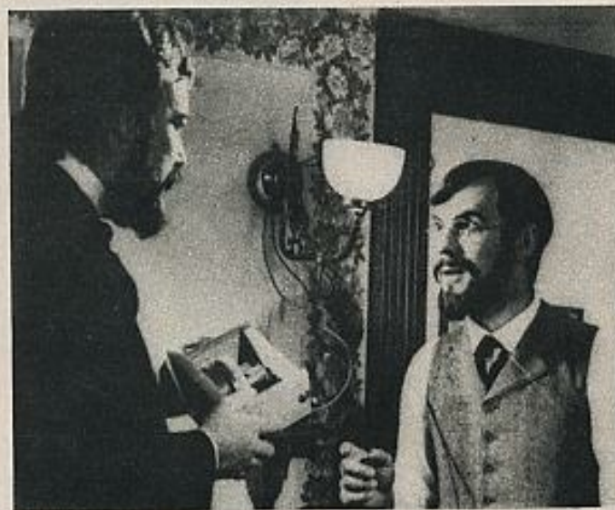
Fotograma de "The challenge of choice". Los actores personifican a Graham Bell y Thomas Watson: nació el teléfono.

¿Quién dispondrá de ambas cosas? ¿Cómo no echar un jarrito de agua helada sobre el inminente calor publicitario del Día Mundial de las Telecomunicaciones? ¿A qué viene este entusiasmo americanizante y religioso? ¿Cómo es posible que nadie recuerde que la multiplicación de una mercancía deseable —y la información lo es— reduce la posibilidad de que esa mercancía