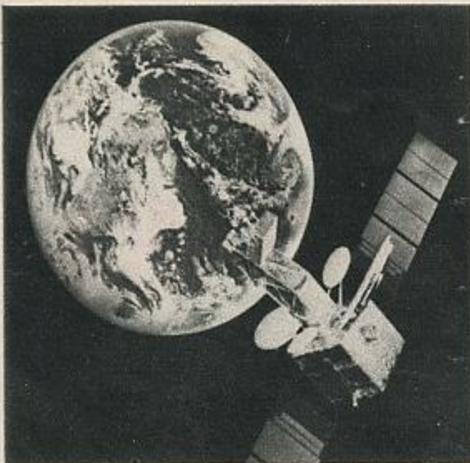
Satélite de comunicación.