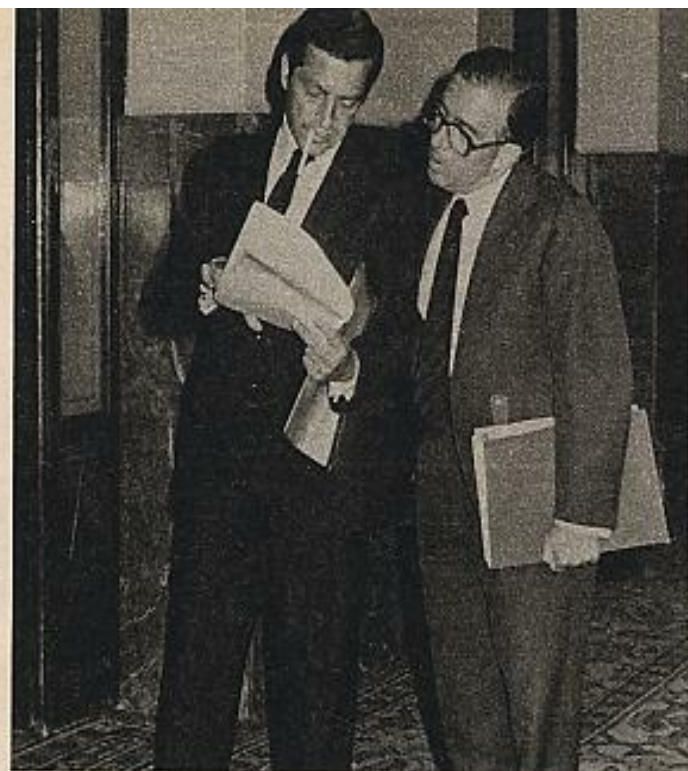
Marcelino Oreja con Adolfo Suárez.