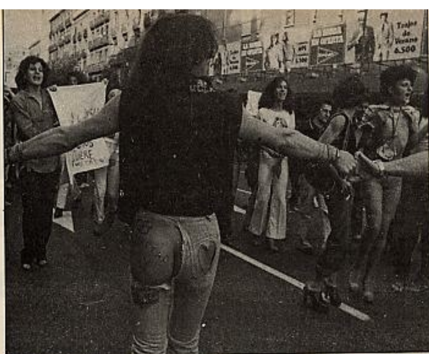
La reacción frente a los homosexuales, como hacia otros grupos marginales, ha sido moralista y discriminatoria.

Desde Erasmo han sido muchos los humanistas y en especial en las décadas de este siglo, que han tenido que trasterrarse como opción de supervivencia, huyendo de las consignas como almas en pena. Y, por ello, en nuestras diarias actualidades cada vez que un conductor de masas, occidental o tercermundista, lanza al espacio sus consignas «ideológicas» uno se echa a temblar y con tristeza y poca resignación se ve abocado a encerrarse entre papeles y libros, ya que las fronteras actuales, con esos intercambios de mensajes de dictador a dictadores, no presuponen garantías para las libertades de uno. ■ R.M.S.