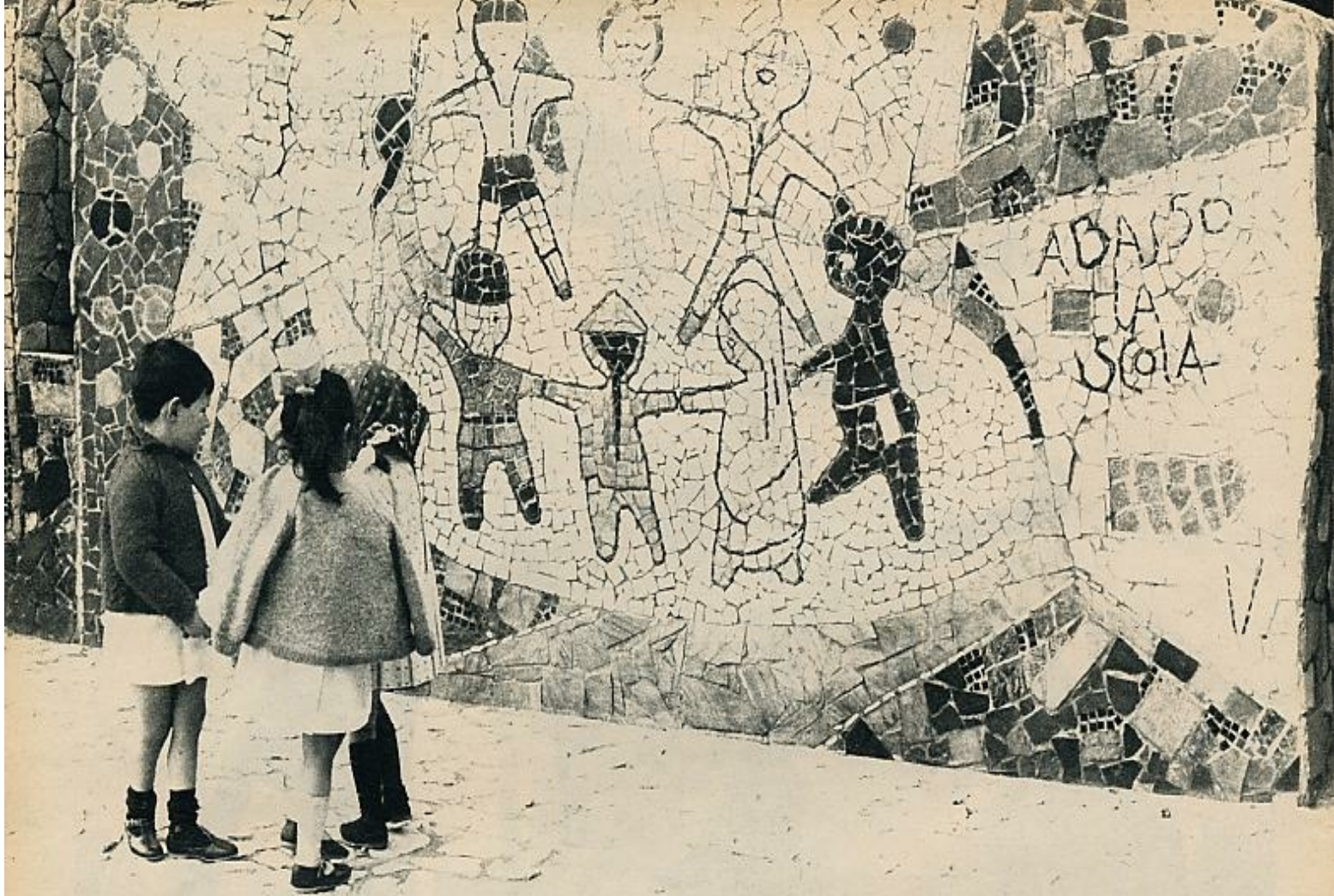
Los mosaicos del parque reproducen diversos pasajes del cuento, escrito por Carlo Collodi, un oscuro periodista florentino que sólo alcanzó notoriedad después de su muerte. En la foto inferior, uno de los varios stands dedicados a la venta de objetos y recuerdos relacionados con el personaje del famoso cuento infantil.