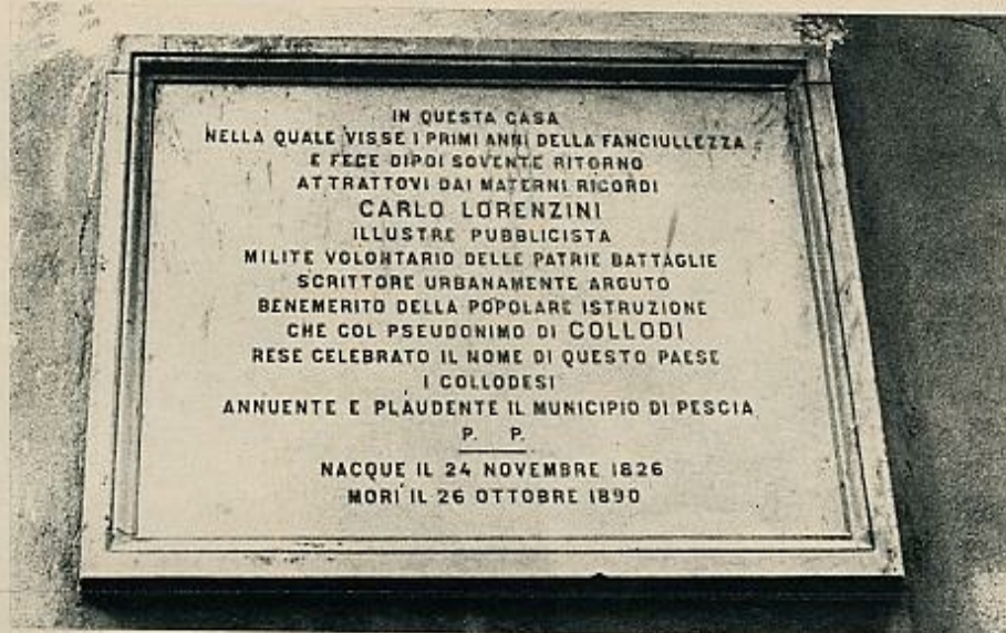
Los habitantes de Pescia han puesto una placa en la casa donde nació el autor Carlo Collodi. Los niños italianos tienen ya su Disneylandia, este parque con motivos de uno de los más populares personajes de cuento.