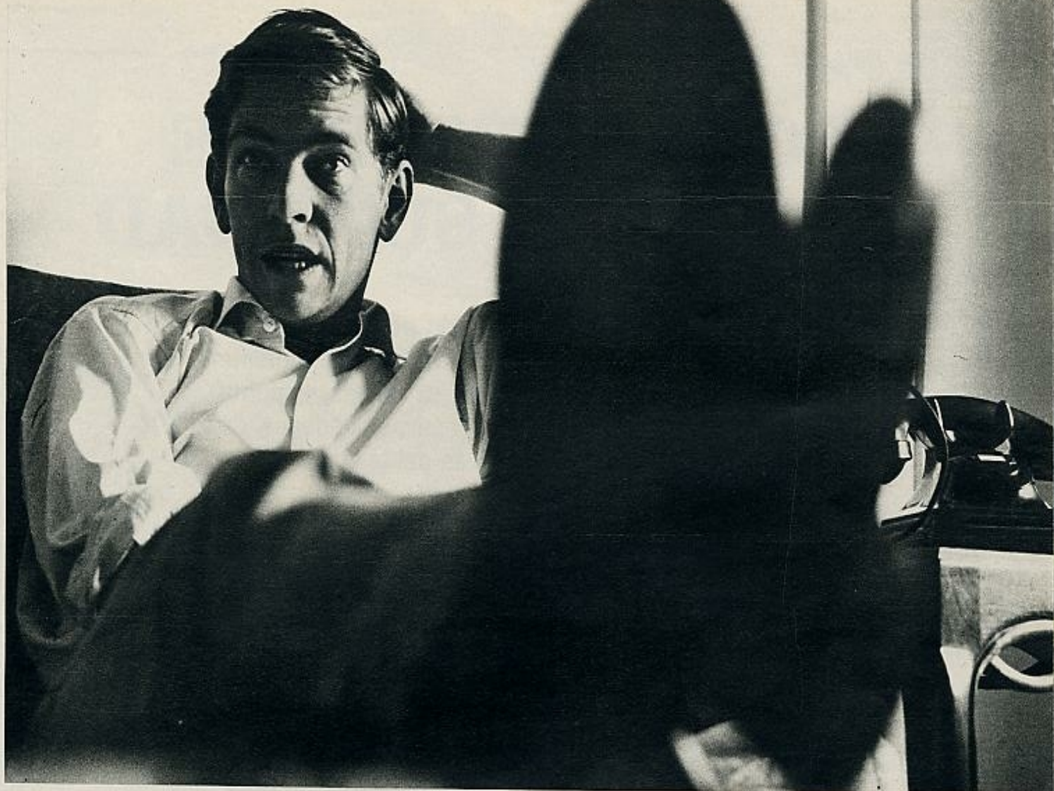
Entre sus compositores preferidos se encuentra Brahms. Durante la entrevista, en un momento en que el magnetofón se descompuso, Courtenay nos propuso oír el 2.º concierto para piano del músico alemán. Entre los directores de cine admira a Tony Richardson, que le descubrió y a Losey y Lean, que le consagraron.

cuatro años». Es decir, en este corto espacio de tiempo, Courtenay ha pasado de ser un estudiante a convertirse en un actor de primera fila, de renombre internacional. «Mientras trabajaba en el teatro hice mi primera película con Tony Richardson. Yo entonces pensaba que el director tenía que explicarme muchas cosas: estaba acostumbrado al teatro, pero Richardson no me daba ninguna indicación; a medida que pasaba el tiempo, me di cuenta de que ésa era la mejor forma de dirigirme para ese papel». Aquella película era «La soledad del corredor de fondo», basada en la novela homónima de Allan Sillitoe. En esa película hacía un pequeño papel James Fox, actor al que utilizaría luego magistralmente Joseph Losey en «The Servant». Otra de las características del nuevo cine inglés es precisamente la promoción de jóvenes actores que ha formado Courtenay opina que los mejores actores del mundo están actualmente en Inglaterra: Finney, Bates, Fox; y también los veteranos: Olivier, Guinness, Readgrave. A juzgar por sus films, puede considerarse a Courtenay como un actor que opta por la interpretación interior. «No exactamente. Se trata de una característica personal. Yo soy un hombre muy reservado; pero esto puede deberse a que yo tengo ahora poca experiencia, quizá dentro de unos años mi manera de interpretar cambie, se modifique. Me ocurre también otra cosa: si yo interpretara el «Hamlet» me