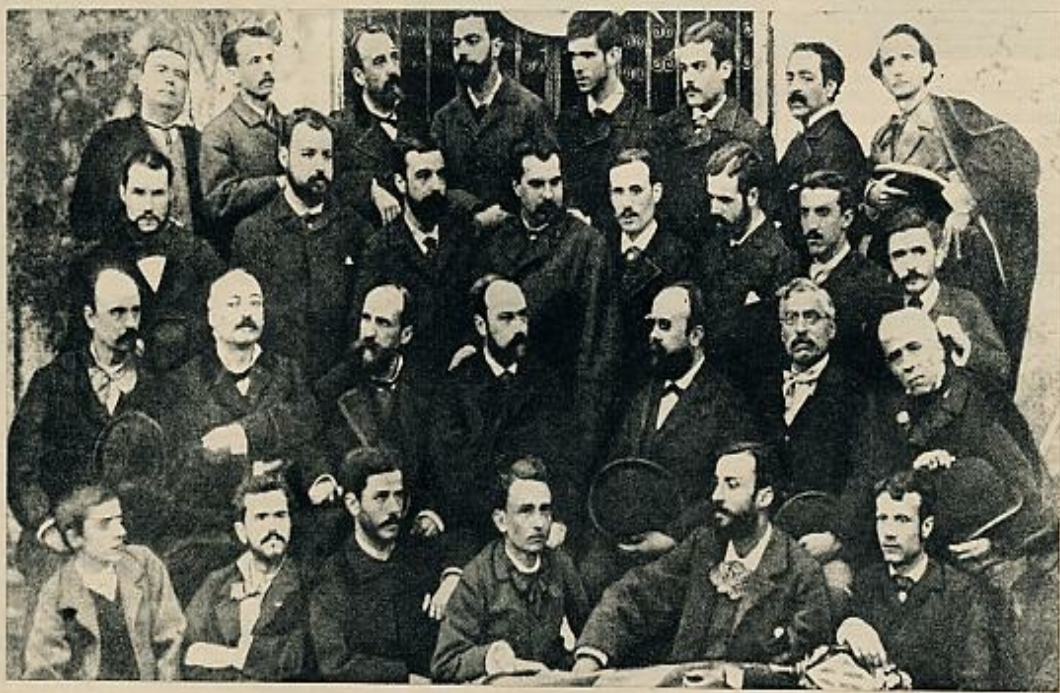
El fundador y primer director de «Las Provincias» rodeado de poetas y escritores de la época, muchos de ellos colaboradores del diario.

EL «Lunik-9» se ha posado en la Luna. Viajar de la Tierra a la Luna no parece un imposible en 1966. «De la Tierra a la Luna» se llama precisamente, la novela de Julio Verne que el 31 de enero de 1866 comenzaba a publicar en Valencia el diario Las Provincias , que aquel día salía por vez primera a la calle. Desde entonces no ha dejado de hacerlo. Cumplir un siglo es algo importante en un periódico: significa subir a una cota a la que pocos llegan y una continuidad difícil de sostener. En cien años varía mucho la vida y puede pasarse de la ficción a la realidad, de Verne al «Lunik-9»; y, también, del «joven que posee las letras española y redondilla desea colocarse de escribiente en una oficina» a la «taquimecanógrafa Inglés, francés se ofrece», o de la vivienda «en un punto muy céntrico de la ciudad» que «se alquila, por la módica cantidad de 44 reales mensuales», al «hotelito amueblado 16.000». El periodismo, sujeto al tiempo más que cualquier otra cosa, acusa este paso temporal. Es una industria «transfor-