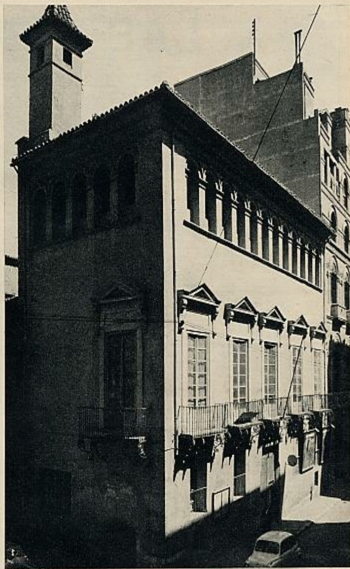
Antiguo edificio del diario, en la calle del Mar, donde estuvo a fines del siglo pasado.