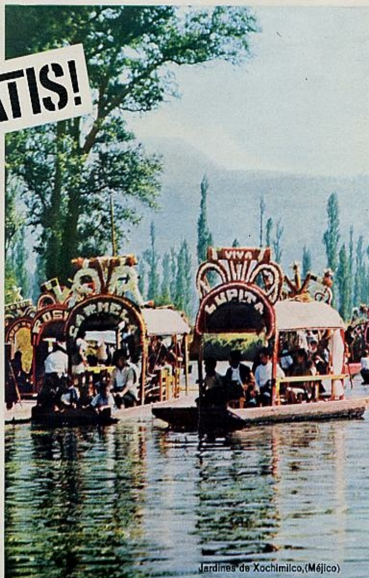
Jardines de Xochimilco, (Méjico)