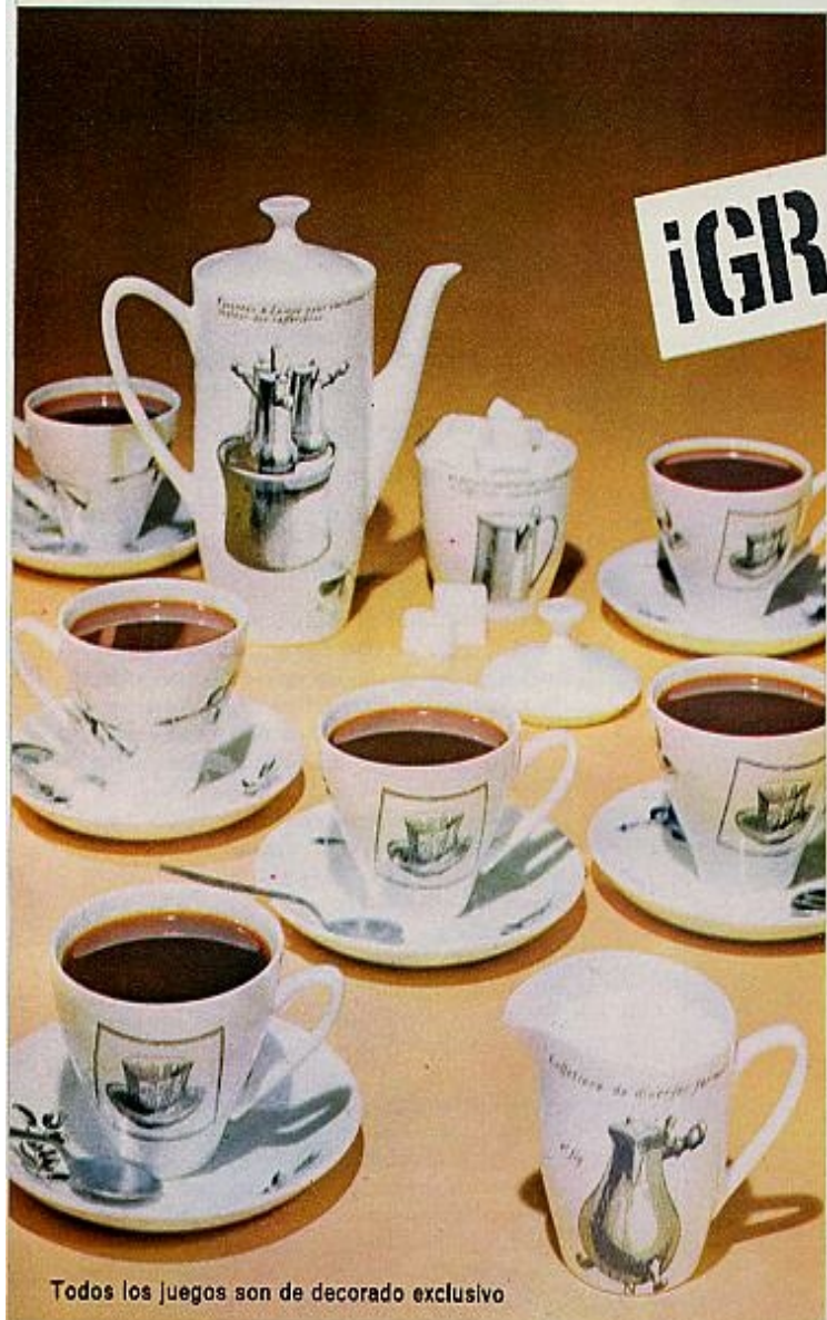
Todos los juegos son de decorado exclusivo

*COMPRE SU FRASCO Y VEA EL DORSO DE LA ETIQUETA