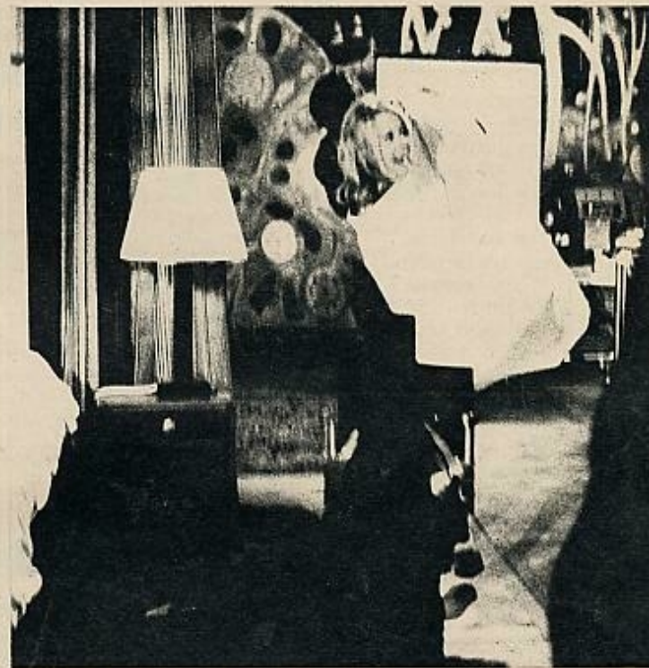
Un nuevo actor inglés, dispuesto a escalar la fama internacional que han conseguido colegas suyos compatriotas: Peter McEnerry, lanzado por Vadim con Jane Fonda.

LOS actores ingleses son, en este momento, y sin duda alguna, los mejores del mundo. Frente al tradicionalismo de la vieja escuela, ha surgido una nueva promoción de hombres y mujeres jóvenes, procedentes en su mayoría del teatro, que ha logrado dar una nueva savia al acartonamiento que regía en las películas supercorrectas que marcaban la tónica general del cine británico. Al margen del fenómeno Julie Christie, la revelación más espectacular de los últimos tiempos, sancionada internacionalmente por el Oscar de Hollywood, toda una serie de actores y actrices se va imponiendo fuera de la isla. Los cuatro fabulosos intérpretes de «The Knack», de Lester; Albert Finney, a quien el público español conoce únicamente por