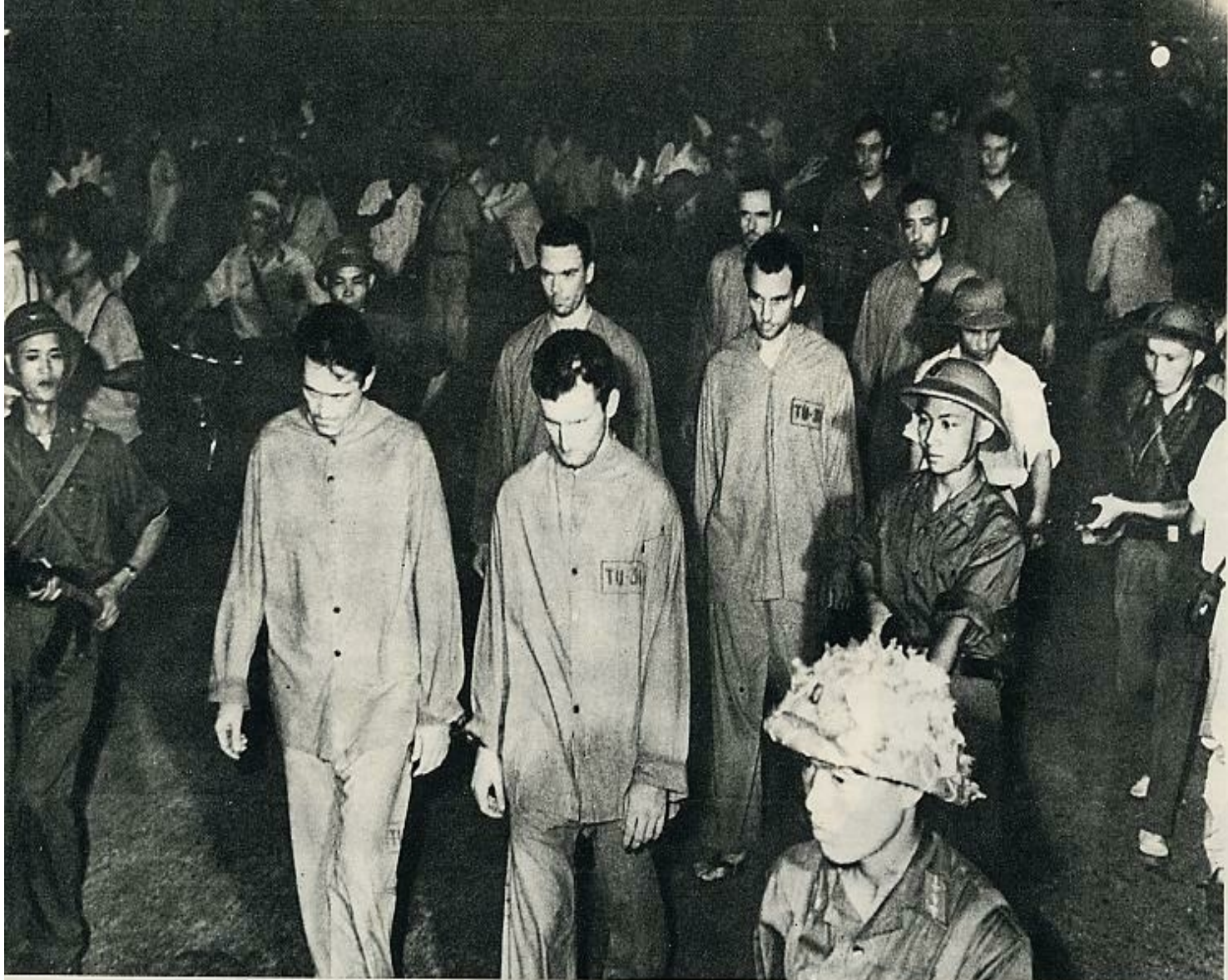
Distinto plano de la procesión de pilotos norteamericanos, paseados por las calles céntricas de Hanoi. Iban esposados entre sí y custodiados por guardia armada.