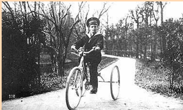
El pequeño Zarevich, Alexis