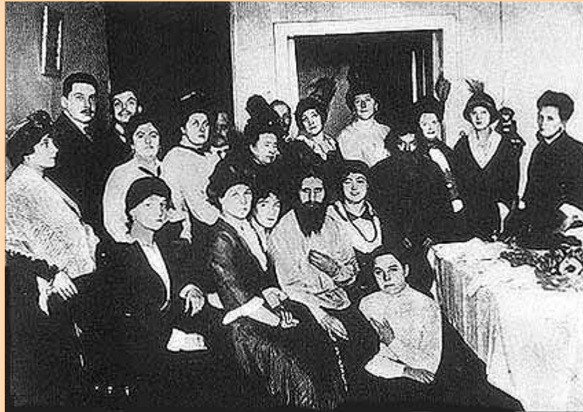
La sociedad rica reunida alrededor de Rasputín, a la que solía recibir en sus apartamentos.