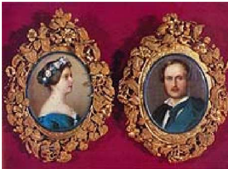
Retratos de la Reina Victoria y del Príncipe Alberto