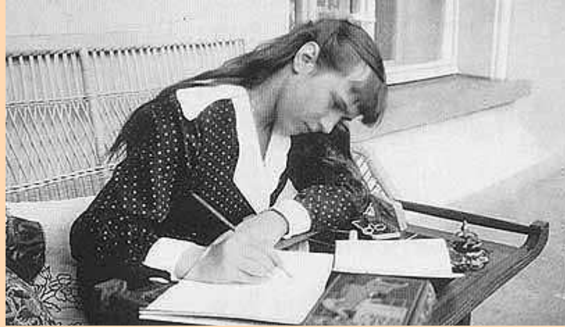
La Gran Duquesa Anastasia, estudiando.

familia imperial era muy aficionada a la fotografía) y sus hijas, las tres Grandes Duquesas mayores.