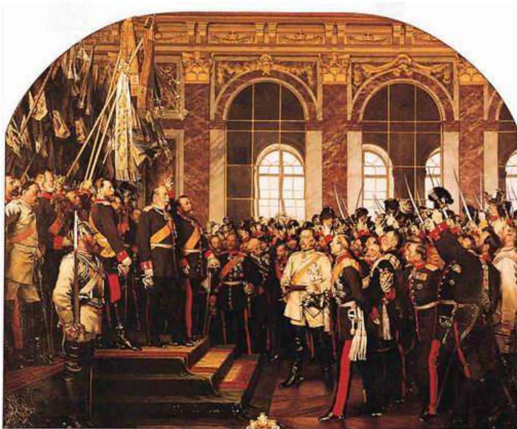
Proclamación del Reich alemán en Versalles, enero de 1871