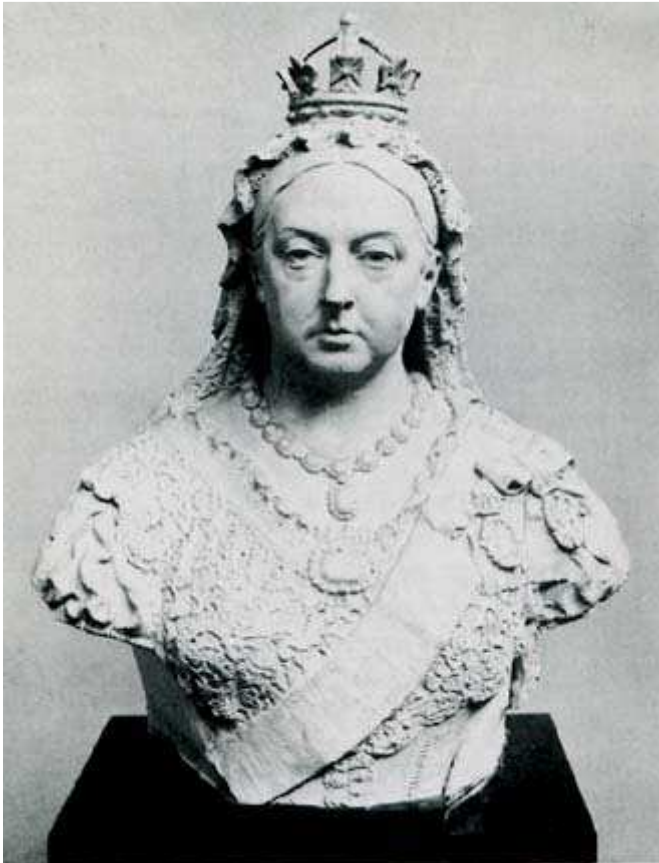
Queen Victoria 1887