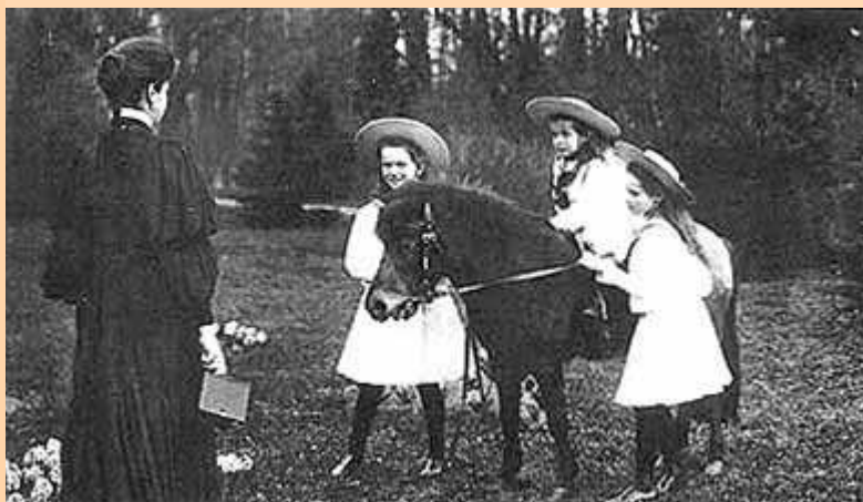
La Emperatriz con una máquina fotográfica en la mano (toda la