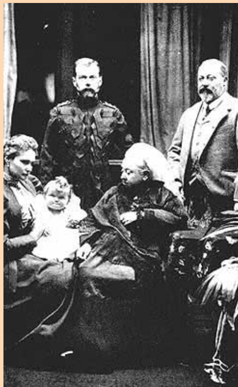
El zar Nicolás II y la zarina Alexandra, con la reina Victoria y el príncipe de Gales, el futuro Eduardo VII.