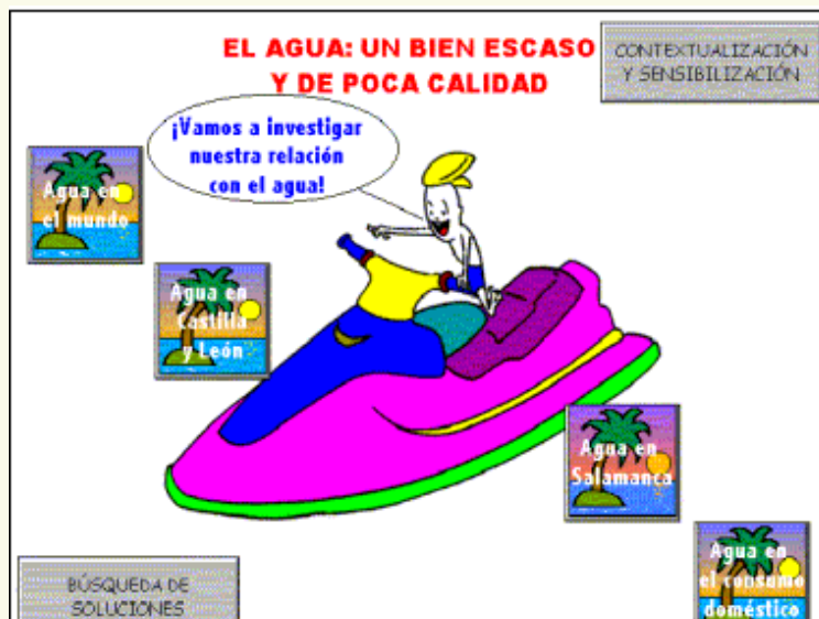
Figura 3. Pantalla de menú de subtemas

Búsqueda de soluciones: A la vista de lo tratado, se trata de poner los medios necesarios para que el estudiante saque las conclusiones pertinentes para poder contribuir a la protección del medio ambiente en su entorno inmediato y en su vida diaria.