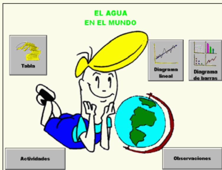
Figura 4. Pantalla de menú de cada subtema

Un paso posterior permite acceder, activando cada subtema, a las diversas actividades que se presentan con las siguientes opciones (ver, por ejemplo, Figura 4):