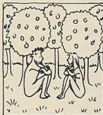
Habla muchas manzanas... y nadie tenía ganas.

Humanidad. Al pie de las viñetas, la empresa de referencia afirma que «No podemos proporcionarle serpientes amaestradas, pero sí asesorarle sobre sus posibilidades en presentadores».