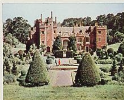
Compton Wynnyates, casa solariega de estilo Tudor.

cada mañana puede admirarse el pintoresco Relevo de la Guardia... Recorra la City y visite la Torre de Londres, con 900 años de antigüedad, donde los alabarderos, vestidos con sus tradicionales uniformes, custodian las joyas reales... Llegue hasta el Palacio de Hampton Court del rey Enrique VIII... Londres, y toda Gran Bretaña, guardan ocultos muchos tesoros para usted. Descúbralos.