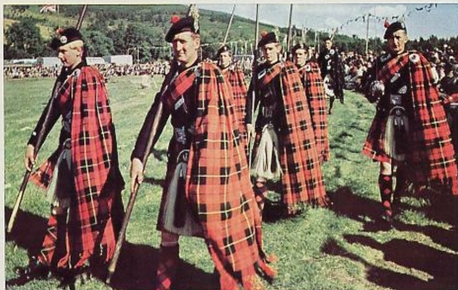
La Marcha de los Clanes en Escocia.

El Londres tradicional, por ejemplo. Comience su recorrido al pie de la Columna de Nelson, en Trafalgar Square; un corto paseo a través del Mall le llevará al Palacio de Buckingham, donde