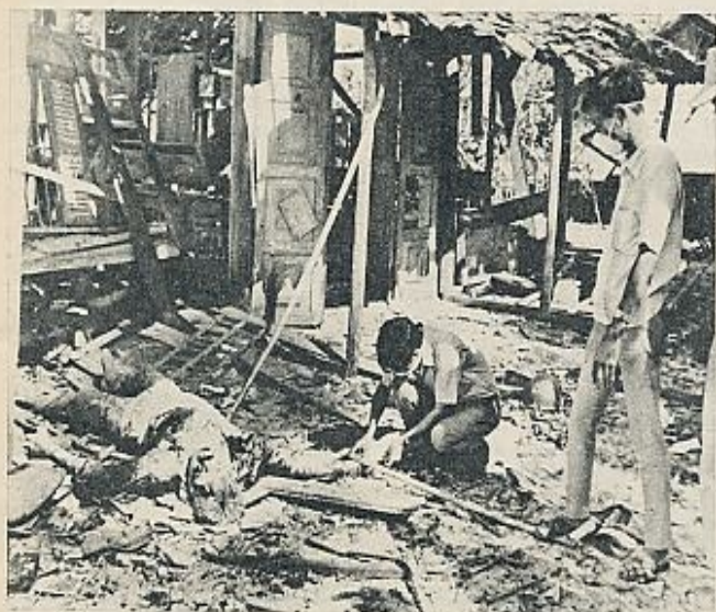
Tras el bombardeo, el recuento de las víctimas, cuya identificación sólo es posible —como en el presente caso— a base de tomar las huellas digitales.

talla abierta contra la Presidencia. Hay que advertir que el Presidente tiene en sus manos, según la Constitución, medios suficientes para continuar la guerra a pesar del Congreso, pero que esta insurrección abierta de los representantes del pueblo puede serle muy dura. Nixon sabe que difícilmente puede gobernar el país si mantiene esta enorme tensión en la sociedad. Como hemos dicho muchas veces, el Presidente no parece tan dueño de sus actos como para dar la imagen que sin duda desea, como para llegar a una paz que le abriría el camino de la Historia, con el que sin duda sueña.