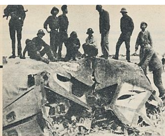
Soldados norvietnamitas sobre los restos de uno de los B-52 derribados por su artillería antiáerea en la provincia de Binh Phu, a veinte kilómetros de Hanoi.