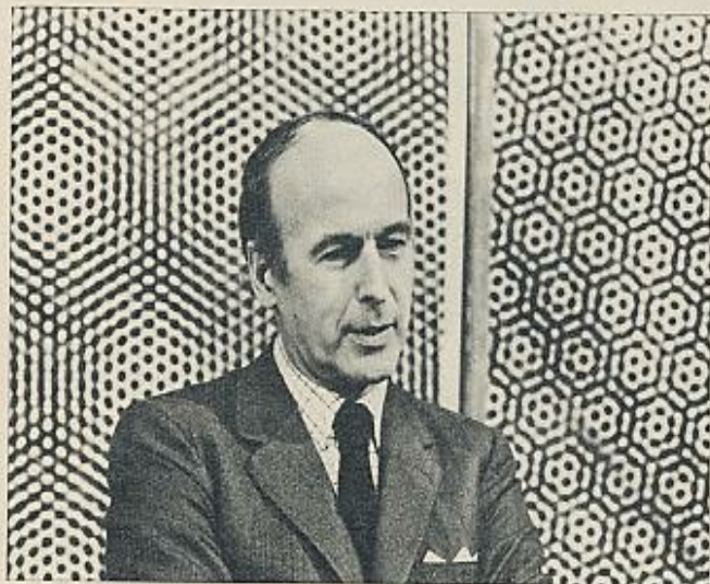
Giscard d'Estaing, uno de los triunfadores de estas elecciones.

zaciones. ¿Qué ofrecía Pompidou a cambio? «Una sociedad libre, con sus imperfecciones y sus injusticias, ciertamente, cómo negarlo; pero que respeta los derechos del individuo; que permite a cada uno servirse como lo entiende, para sí mismo y para sus hijos, de lo que ha adquirido de dirigir y de continuar siendo dueño de su vida y de su destino, tanto como lo es posible». El corolario lo puso el ministro del Interior, en cuyo cargo está el comunicar los resultados electorales, cuando después de dar las cifras, en la noche del domingo, dijo: «El pueblo francés ha elegido las instituciones libres».