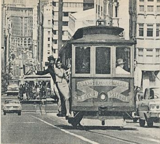
San Francisco, una ciudad llena de juguetes para la imaginación popularizados por el cine. Una ciudad casi amable, casi confiada, situada en la espalda del imperio.

«underground» de la ciudad es como una permanente reserva de fugitivos con sensibilidad que a veces salen a la superficie con sus heridas y distancias convertidas en comunicación, es decir, en música. Y también podemos asistir a la parodia de la juventud del pasado en Winterland, algo así como el Gran Price de Barcelona o Madrid, lleno de miles de jóvenes que contemplan las acciones de cantantes disfrazados de Elvis Presley en los años cincuenta, vestidos como él, gesticulando como él, escupiéndolo como él, con los gestos de lascivia al ralentí, una parodia que arrebató hasta el éxtasis y que requiere cada noche un despliegue policial de Universidad española. Los policías están nerviosos, nos empujan con las porras para que no nos situemos a su altura, quieren dominar el océano de las cabezas agitadas, de vez en cuando abofeteadas o duchadas por haces de luz de focos móviles y las expectoraciones de los cantantes.