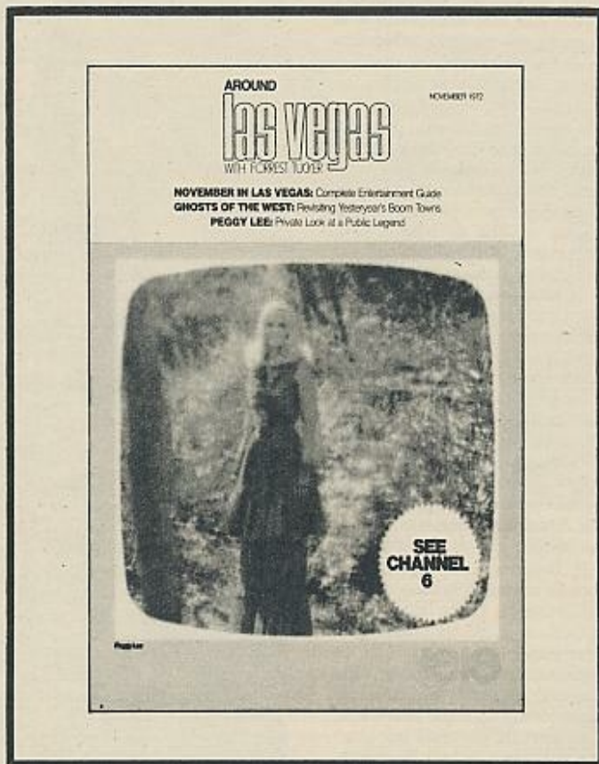
Esta portada de catálogo propagandístico de Las Vegas no muestra ninguna exageración. Buena parte de las damas visitantes de la vida nocturna de Las Vegas visten como Peggy Lee. Es la imagen propia mejor que les devuelve el espejo trucado de la madrastra de Blancanieves y los siete enanitos.

Esa competencia, según Mandel, provocará una «enorme crisis estructural» en la industria de los USA. «Es de suponer que esta "gran crisis estructural" ofrecerá un ímpetu de gran magnitud a la "desnaturalización" de los sindicatos a favor de la revolución». Nicolaus opone a esta conclusión mandeliana datos, informes, a veces simple lógica, que demuestran que los Estados Unidos están en condiciones de regular su propia competencia a nivel de mercado mundial: 1.º, por el predominio del capital de la Banca norteamericana; 2.º, por la función de las inversiones directas de USA en