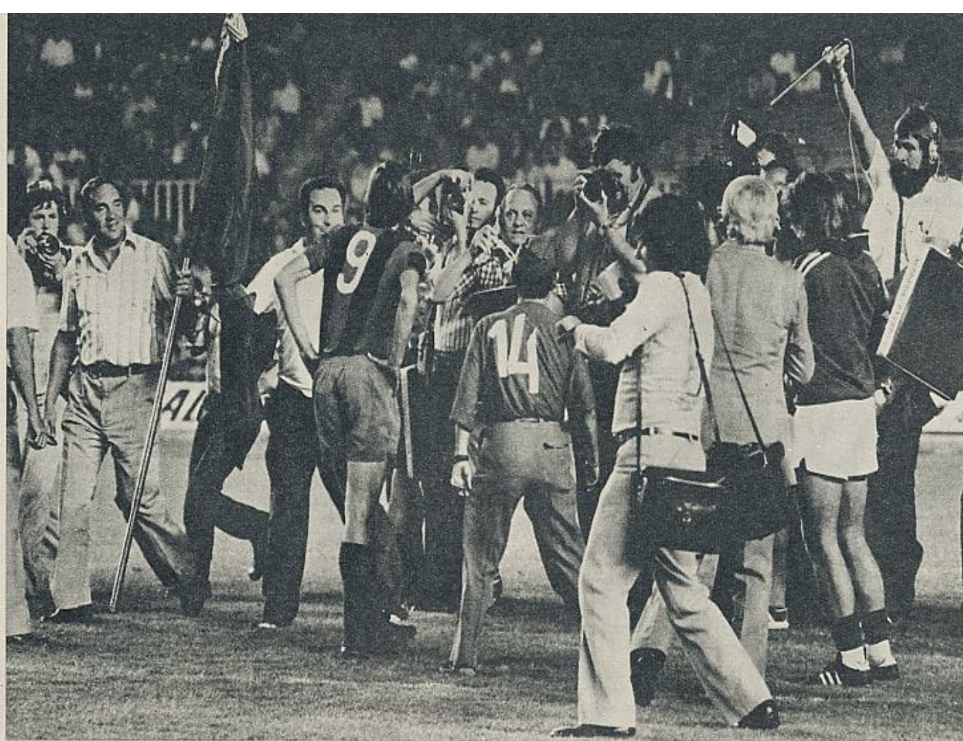
Cruyff, Cruyff, Cruyff... es el ruido de la noche. El jugador es materialmente asaltado por los fotógrafos. Las entradas para el partido de presentación han sido las más caras de toda la historia del club. Se ha llegado al final de una larga operación...