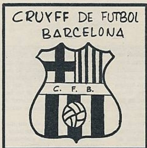
La nueva denominación del Club de Fútbol Barcelona que propone Perich.