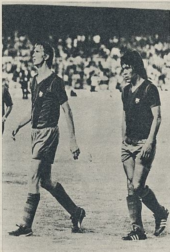
Cruyff y Sotil, la «vedette» de ahora y la de agosto. Un jefe de Estado Mayor y una vulgarización futbolística del «boom» de Vargas Llosa... En la noche de la presentación, el público estuvo a favor de los recién fichados y, en cambio, no perdonaba un error a los nacionales...

U NA alta personalidad del Consejo Superior de Investigaciones Científicas está escandalizada; la prensa de Madrid se muestra muy reticente ante los millones gastados por el Barcelona en el fichaje de Cruyff; los periódicos de la Ciudad Condal se llenan de cartas de lectores en las que se toma posición en pro o en contra del fichaje; los hay que hablan de «monstruosidad» en unos tiempos en que sigue habiendo hambre en el mundo y hay tanto desastre bélico que curar; los hay que hablan de la necesidad barcelonista y catalana de «reafirmarse»; las entradas para el partido de presentación de Cruyff han sido las más caras de toda la historia del club, y hemos de tener en cuenta que los precios de taquilla del Barça son de los más baratos de España; el precio de las almohadillas se ha duplicado, sin el menor respeto por las declaraciones oficiales sobre el tanto por ciento de encarcelamiento de la vida; también son algo más caras las bebidas refrescantes que te venden en los bares concesionarios del estadio; Perich propone, en una aguda caricatura, que a partir de ahora hablemos del «Cruyff de Fútbol Barcelona»; sale Cruyff al campo en la noche de su presentación oficial y es materialmente asaltado por los fotógrafos; Sotil, «vedette» de agosto, o los jugadores nativos tan fotografiados antaño, pasan al desván de los objetos perdidos u olvidados; Cruyff, Cruyff, Cruyff... es el ruido de la noche y ya circula por las gradas del estadio y por la ciudad en-