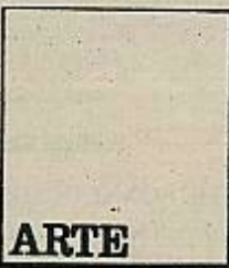
(1) Fuerza y peligro; un análisis de los conceptos de contaminación y tabú, Mary Douglas. Siglo XXI.

La exposición con la cual la Librería Turner se autorizó a sí misma también como galería de arte, si pareció exigir de mí la urgencia de un comentario no lo fue porque esos grabados de Chillida que alberga, ilustraciones a Martin Heidegger y a Jorge Guillén, fuesen a descubrirle a nadie la novedad de un Chillida grabador, sino, más bien, la de un Chillida ilustrador. ¿Ilustrador? Bueno, sí, aceptemos provisionalmente, para no entrar en la marea de las definiciones, una palabra que en este caso no quiere decir que nuestro escultor-graba-