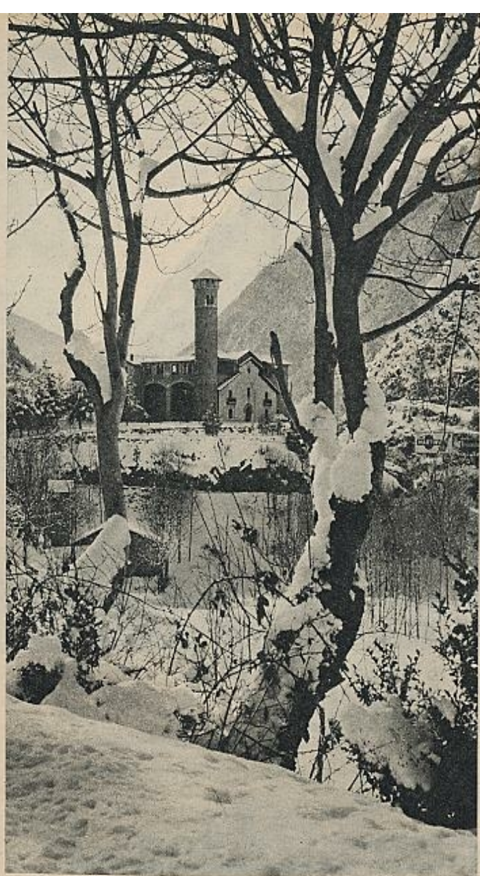
Debido a la abundancia de la nieve, Andorra es un lugar muy visitado por quienes se dedican a los deportes de invierno.

que en el efecto que tienen sobre la circulación fiduciaria. Nos hallamos ante una situación que también creemos inédita en el mundo capitalista, por cuanto la falta de control es total y sistemática. No solamente no existe moneda propia ni un Banco nacional que controle el cambio de moneda, el tipo de interés que dirija, en suma, las inversiones hacia los lugares económicos donde más necesarias son, sino que se ignora totalmente, incluso a nivel oficial, los estados de cuentas de las diversas sociedades que operan en el país: Ingresos, gastos, beneficios, etcétera.