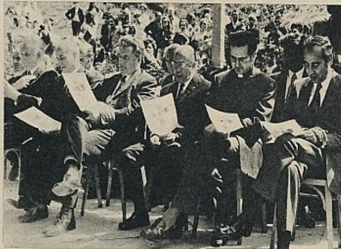
A tenor de las tesis sustentadas por ambos copríncipes, el obispo de Urgel y el presidente francés, poco, por no decir nulo, es el papel que corresponde a los representantes elegidos democráticamente por el pueblo.

enfrentándose violentamente al Consejo, y, al no ceder éste, lo destituye en peso, en 1881. Ello provoca una serie de motines populares, en el curso de los cuales el Consejo declara que «la causa de las graves perturbaciones del país lo constituye el empeño particular de los obispos en querer