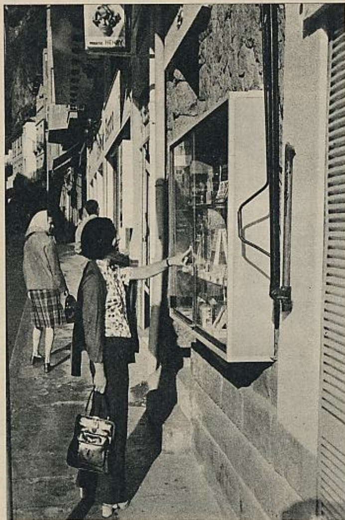
Dos millones y pico de turistas visitan anualmente el pequeño país de los Pirineos, que sólo cuenta 23.000 habitantes.

La actitud política de los copríncipes episcopales y las continuas entradas de las tropas españolas en territorio andorrano, a consecuencia de la actitud adoptada por la mitra en los conflictos españoles, ha provocado, mientras tanto, el desprestigio de sus partidarios en el interior de los Valles, y los períodos de libertad de que se ha