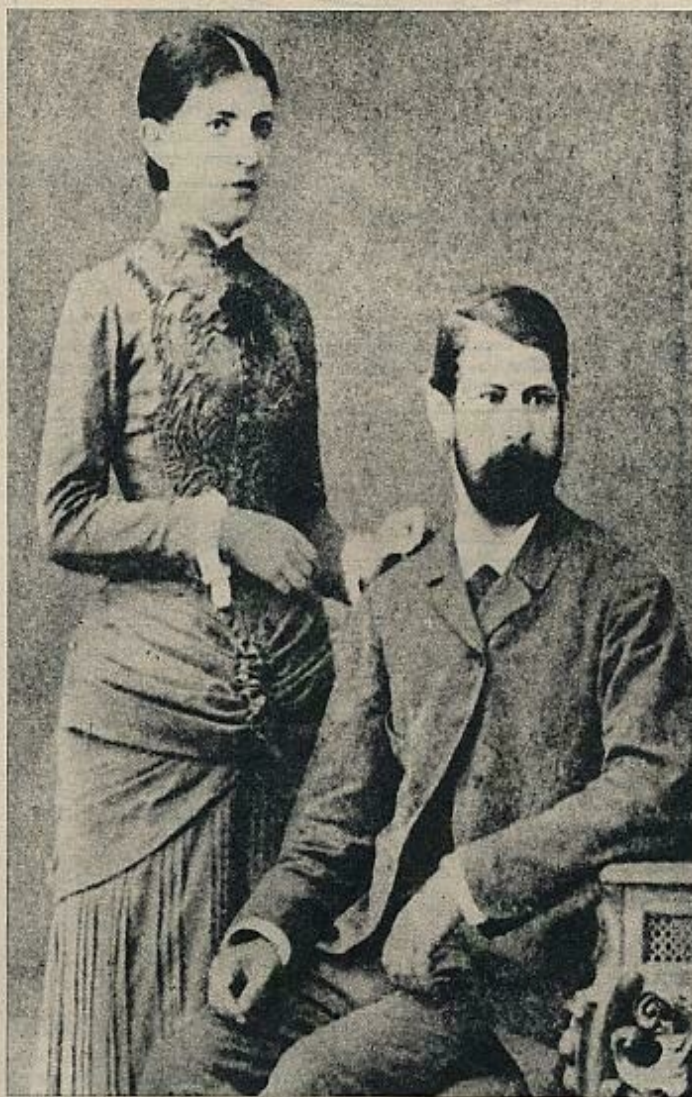
El fundador del psicoanálisis con Martha Bernays, en 1885.

te su propia ignorancia en materia de judaísmo, y que, por inverosímil que parezca, se afirmaba incapaz de leer la dedicatoria escrita en hebreo en un libro que le regaló uno de sus discípulos. Jacob Freud, padre de Sigmund-Salomon, había dado ya el primer paso hacia la «asimilación». Sus hijos no recibieron de él sino la forma sin contenido de un ju-