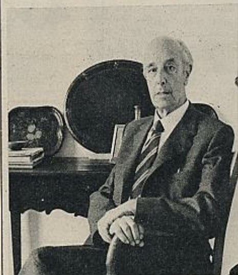
En la obra del mallorquín Lorenzo Villalonga no sólo se descubre que cualquier tiempo pasado fue mejor, sino que cualquier tiempo futuro será peor.

zaba, o bien se encontraba en el descanso entre uno y otro tiempo; desvalidos frente a la grosera realidad materialista, son personajes inmunes espiritualmente a cualquier agresión de esa realidad. Y en último extremo les salva su inocencia o su ignorancia.