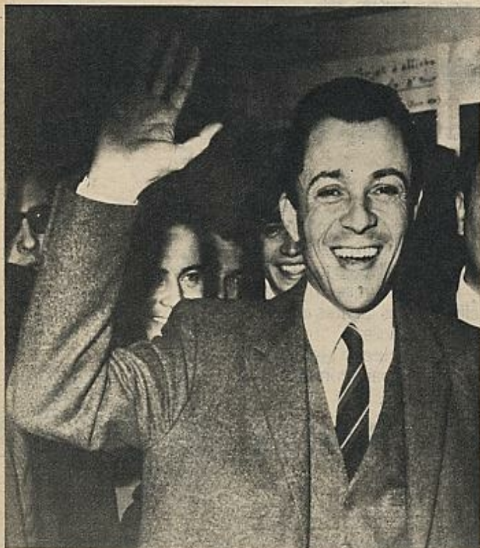
Un informe secreto de Michel Rocard indica que la situación económico-social en Francia en un par de meses obligará a Giscard d'Estaing a lanzar un llamamiento a la unidad nacional para reagrupar a los gaudistas díscolos y atraerse a muchos socialistas. En la foto, Rocard, durante las legislativas del sesenta y nueve.