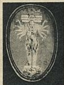
Una muestra de "Arte Tantra".