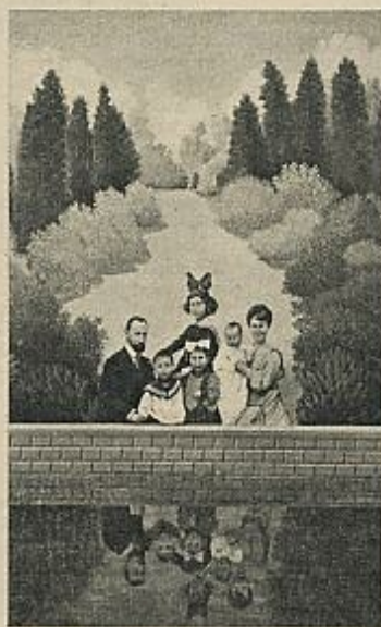
Obra de Isabel Villar.