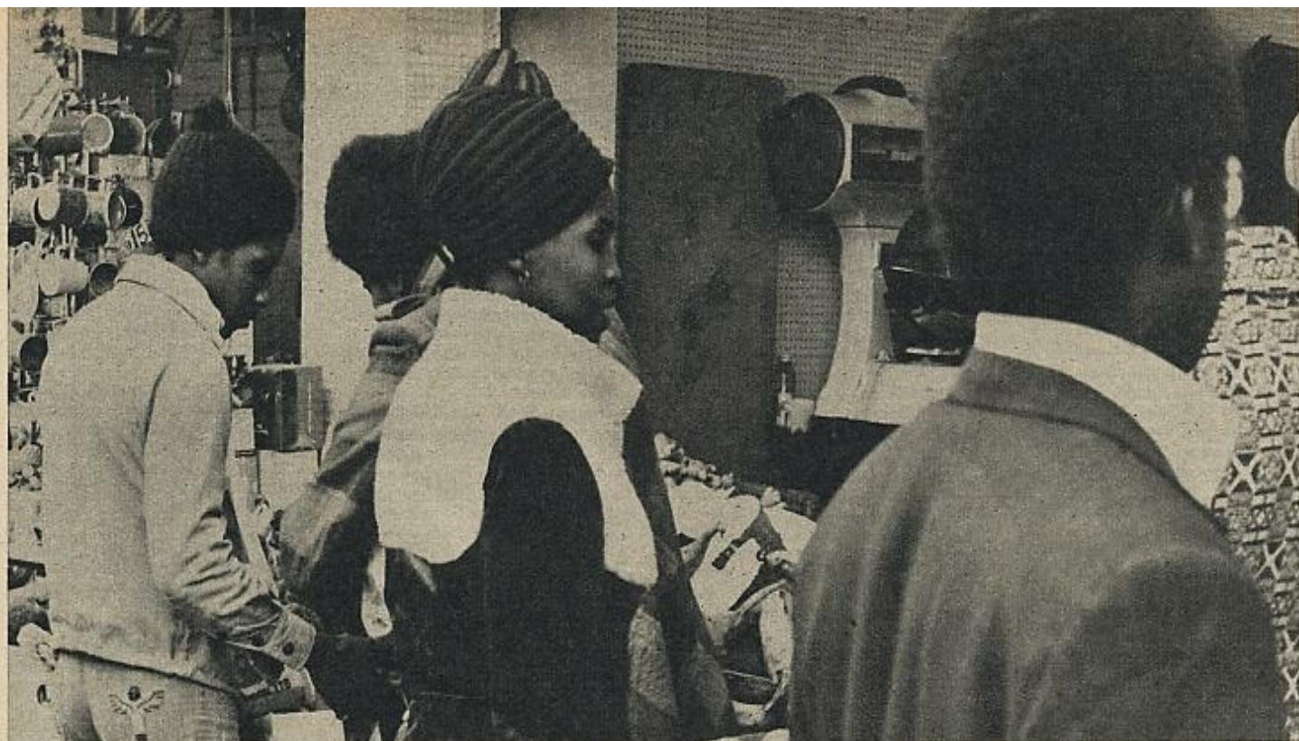
Los blancos fueron empujando a los inmigrantes negros hacia los barrios donde nadie quería vivir: Brixton, Hackney... En la foto, mercado en Brixton (Londres).