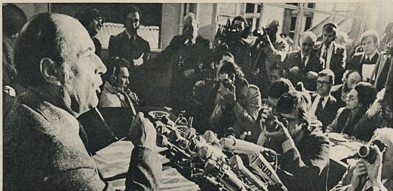
Los socialistas de Mitterrand acusan a los comunistas de celos por los votos que les han quitado, por los resultados de los últimos sondeos.

D ESPUES de cuatro meses de querellas, en un «crescendo» del que la conferencia de prensa de Marchais marca ahora el punto máximo —hasta el próximo—, la unión de la izquierda francesa está realmente maltrecha. Como siempre, como en todas partes (véase Portugal). Prácticamente le falta muy poco para disolverse. Le falta única-