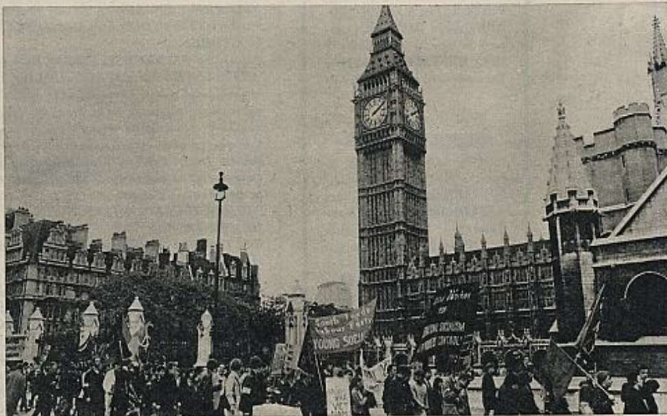
El afán por mediatizar los Parlamentos, cuando ya se han cedido las libertades de sufragio, es contemporánea.

PORQUE ahora hay que decir que la democracia no ha dirigido nunca totalmente ningún país. La democracia es algo en creación, algo en desarrollo, algo que se lucha por implantar. Cuando surge en Francia, realizada por una burguesía con apoyo popular, tiene ya inmediatamente sus enemigos contradiciéndola. No es posible ni siquiera inventariar aquí los diversos métodos de anulación o desecación de la democracia. Uno ha sido el de la reducción del número y la calidad de los electores: restricciones de edad, situación económica —sólo votaban, en tiempos, los que acreditaban una determinada renta o ingreso alto—, sexo, grado de cultura —como las restricciones contra los analfabetos— han ido venciendo poco a poco con el paso del tiempo. El derecho del voto a la mujer no se ha dado hasta hace muy poco tiempo, y en algunos países, solamente después de la segunda guerra mundial; la edad de votar está ahora bajando en algunos países a los dieciocho años, pero la