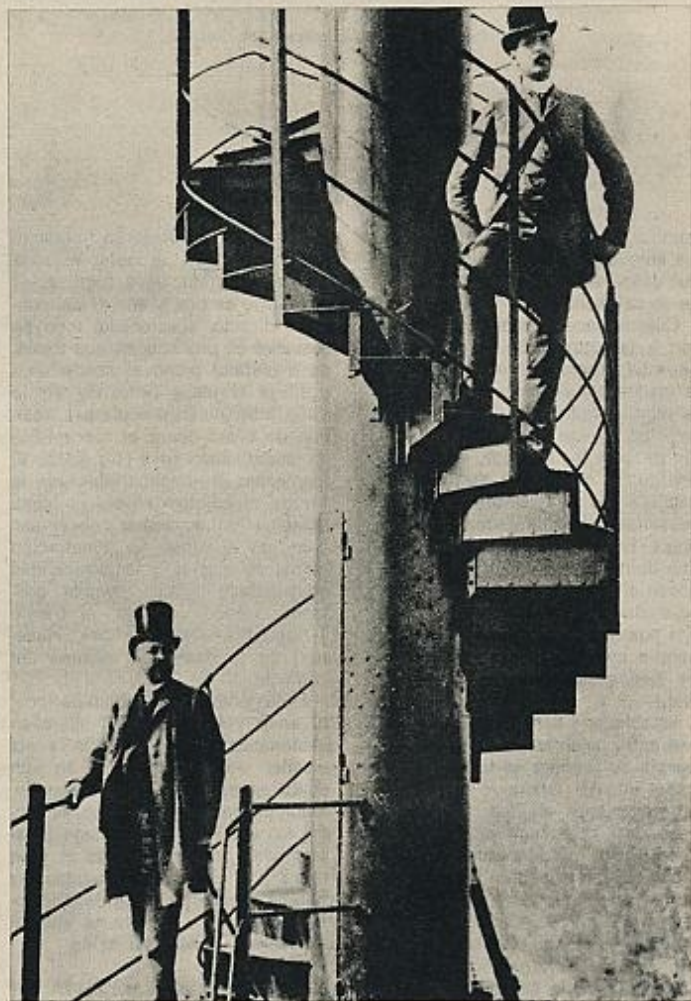
Gustave Eiffel y su yerno, Adolphe Salles, en lo alto de la torre.

en la exaltación del chauvinismo, tenemos derecho a proclamar bien alto que París es ciudad sin rival en el mundo». Y la ciudad —seguían— se vería humillada. La torre sería «el deshonor de París», y ni siquiera «la mercantil América» querría una cosa así. «Como una gigantesca y negra chimenea de fábrica», aplastaría los monumentos durante