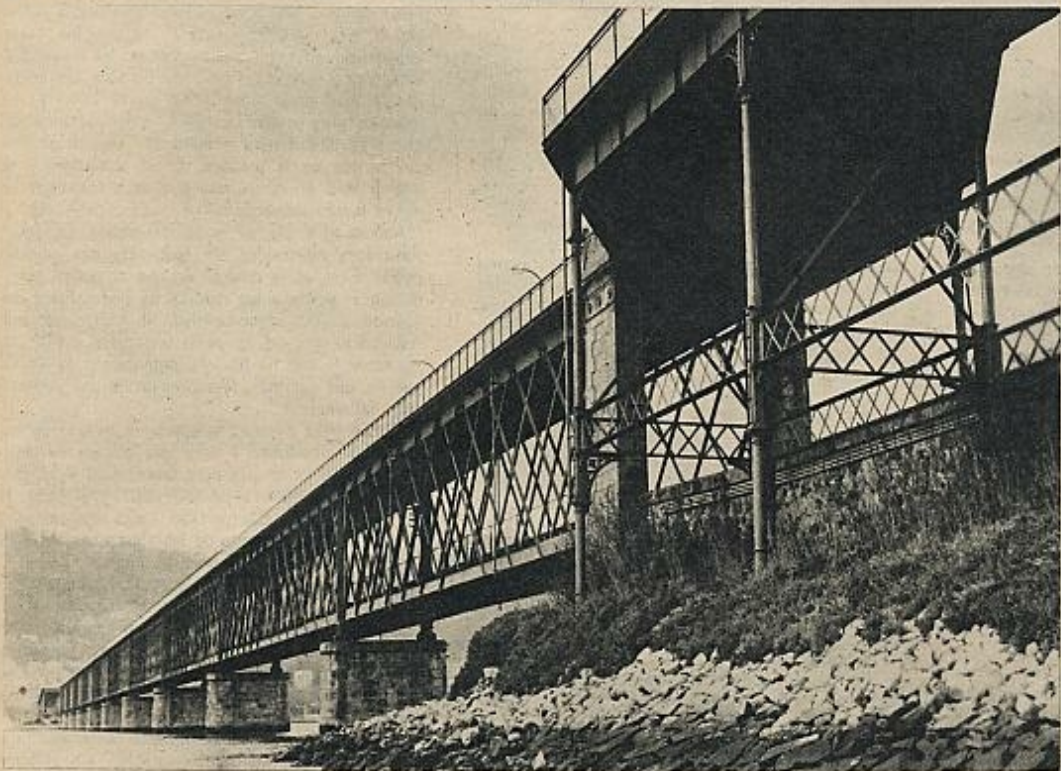
Arriba, el puente María Pia, en Oporto, uno de los preferidos por Gustave Eiffel entre los muchos que hizo a lo largo de su fecunda carrera.

ingeniería (lo que hoy es un «consulting»), y que se envía esté donde esté la obra, poco menos que sin conocer el sitio... Y no es que yo esté a favor de una cosa o de la otra, pero en este segundo caso no puede asignarse la obra a una sola persona: ¿de quién es la paternidad? Yo no quiero buscar sólo al ingeniero artista. Hay muchas clases de ingenieros, y todos son respetables. Pero hemos de reconocer que existen obras con muchos padres, y eso es también muy hermoso...».