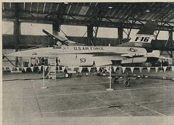
Lo que ha pesado sobre todo ha sido la capacidad mayor de manipulación de la industria norteamericana, y la mayor fuerza de USA en Europa.

La cuestión de la mejor o peor calidad de los aviones en competencia apenas se plantea. Aunque, naturalmente, la elección se basa en condiciones de mejor calidad y precio, la realidad parece ser la de que los dos aviones sirven con la misma capacidad su cometido. Lo que ha pesado es, sobre todo, la capacidad mayor de manipulación de la industria americana, de los encargados de las compras y de la mayor fuerza de los Estados Unidos en Europa. Este «test» europeo también ha resultado fallido.