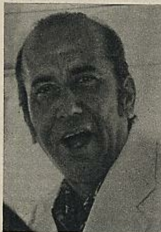
La nacionalización del petróleo anunciada por Carlos Andrés Pérez, actual Presidente de la República, obtuvo el consenso de todos los sectores políticos y de la mayor parte de los ciudadanos.