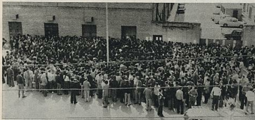
ASAMBLEA EN HYTASA

Otra empresa multinacional en la que se ha conseguido una coordinación operativa a nivel europeo es la Michelin. En la reunión de delegados de las diferentes factorías españolas se informó que en el encuentro celebrado en Clermont-Ferrand de todas las empresas europeas se había acordado llevar a cabo una jornada de lucha en apoyo a las reivindicaciones planteadas por Lasarte, Valladolid, Burgos, la acción consistía en principio en una hora de paro general que de no dar resultado se podría ampliar. Por su parte, la empresa sigue sin hacer ningún ofrecimiento aceptable para los trabajadores y les ha dirigido una carta invitándoles a reanudar el trabajo. Las asambleas celebradas para perfilar la posición de las plantillas se han realizado por medio del voto secreto, y los resultados han sido los siguientes: Continuar la huelga, 2.103; volver al trabajo, 15; abstenciones, 12. ■ NICOLAS SARTORIUS.