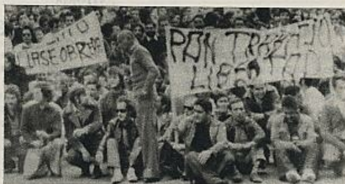
De los 60.000 parados de Málaga, ni siquiera una cuarta parte cobran el seguro de desempleo. En la fotografía, manifestación de obreros de la construcción en paro.

Telettra es otra de las multinacionales que en estos días está en el candelero de la conflictividad madrileña. Ubicada en el recientemente industrializado Torrejón, sus casi 1.000 trabajadores intentan conseguir un aumento de 6.442 pesetas