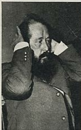
Solyenitsin: Una vergonzosa operación de propaganda antidemocrática.

Todo ello constituye un escándalo de primer orden. Solyenitsin es muy libre de decir cuanto quiera, y en varias ocasiones, cuando estaba perseguido en su país, TRIUNFO lo ha manifestado así y ha informado en su favor, sobre todo en lo que resultó ser el escandaloso proceso que le hizo un comité de intelectuales (V. TRIUNFO,