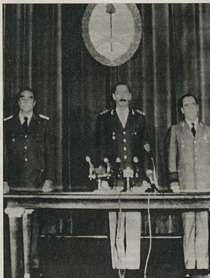
Los tres integrantes de la Junta Militar argentina, almirante Emilio Massera y generales Jorge Videla, centro, y Orlando Agosti, tras la ceremonia de juramento: un Gobierno del agrado de Washington por su anticomunismo.

U N Gobierno al estilo chileno? Probablemente no, en cuanto a la forma sangrienta y represiva con que actúan Pinochet y sus hombres. Pero sí en cuanto al fondo político. Un Gobierno más que complace a Washington, y que es enormemente significativo en la política del cono Sur del hemisferio. Un Gobierno que evitará el viejo desafío argentino-brasileño, porque encontrará a gusto sus relaciones con el Brasil del general Ernesto Geisel. Como las encontrará fáciles con el general Pinochet en Chile, con los militares que dirigen Uruguay (el Presidente civil, Juan María Borda-