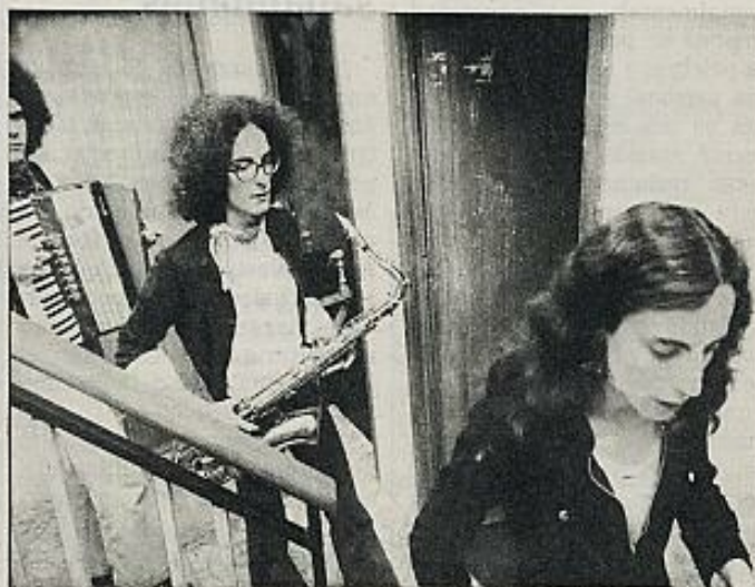
Companya Electrica Dharma.

El último día pudimos ver en una misma sesión lo peor y lo mejor del festival. En primer