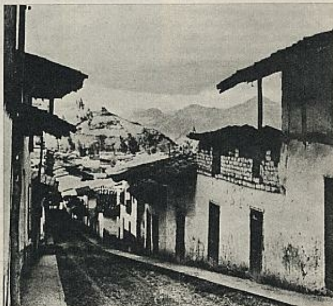
Santiago de Chuco, Perú, pueblo natal de César Vallejo.

"Creo en la predestinación. Cuando entré al colegio, tendría once años, como todas las colegialas, soñaba con mi príncipe encantado. Yo era un tonel, era monstruosa y la mitad de los profesores me consideraba inteligente y la otra mitad me tenía por una retrasada mental. Yo dibujé el perfil de mi futuro príncipe encantado y ese príncipe tenía treinta y cinco años, era sudamericano... y poeta. El perfil era exactamente el de