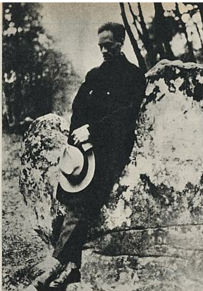
"No había otra cosa que conmoviera más a Vallejo, que le doliera más que la injusticia del mundo". El poeta en París, en 1937.

"Al principio yo era completamente anticomunista. Vallejo tuvo